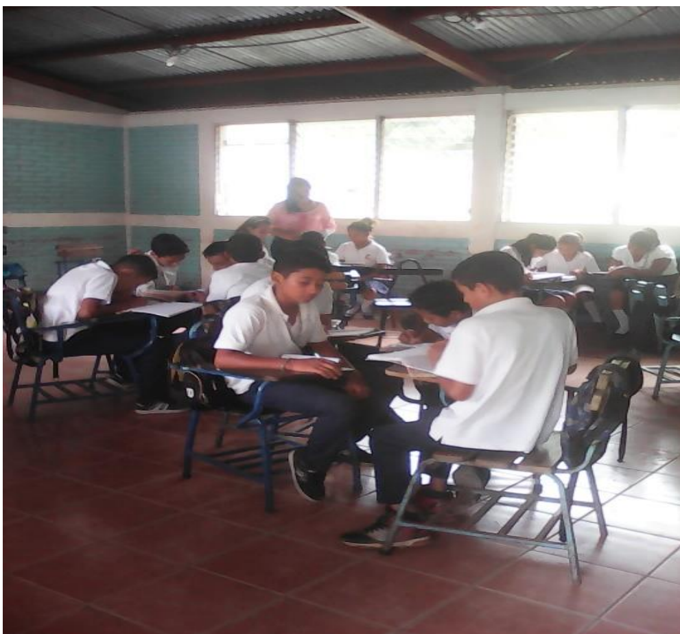
Estudiantes contestando la entrevista, de acuerdo a sus conocimientos adquiridos en el aula de clase.