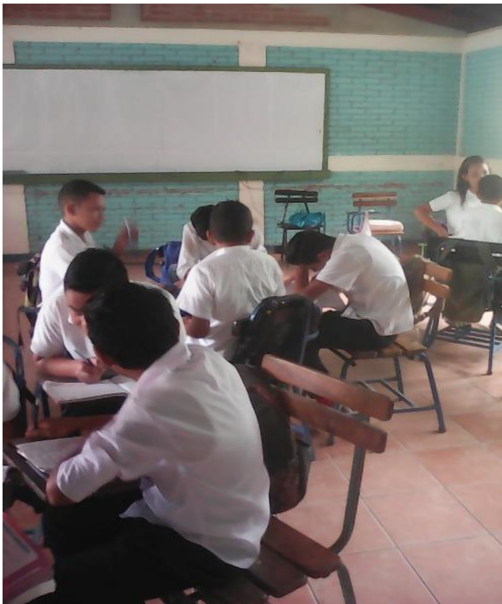
Estudiantes integrados en equipo de trabajo para contestar una guía orientada por el docente.