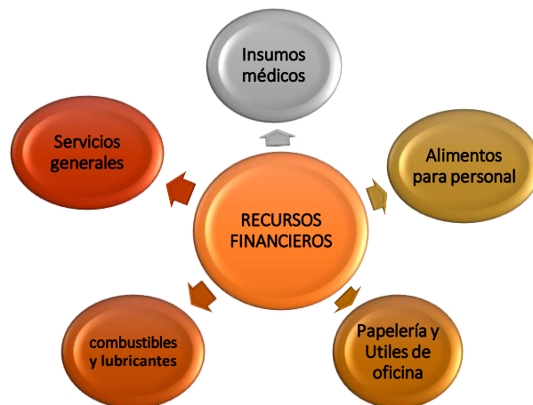
Gráfico N°1: Distribución de los recursos financieros en los bienes y servicios necesarios en el funcionamiento del hospital Pedro Altamirano.