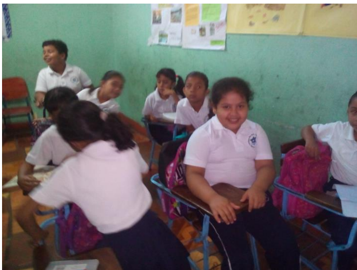
Alumnos de segundo grado a la hora de clases.