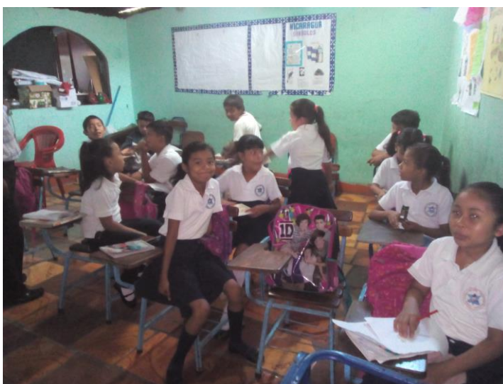
Este es el ambiente en aula de segundo grado