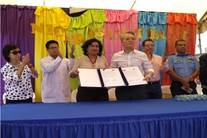
Imagen 5 Donación para rehabilitación de hospitales 2019