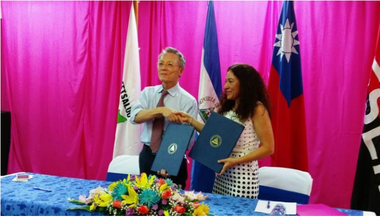
Imagen 4 Donación para sistema eléctrico de hospitales 2018