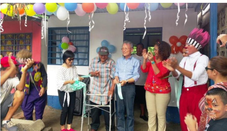
Imagen 3 Entrega de viviendas 2018