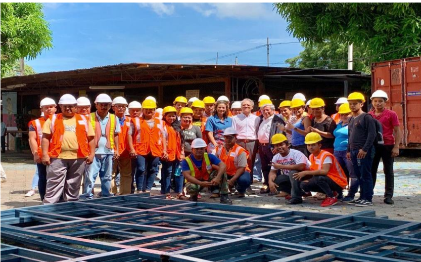
Imagen 6 Desembolso para construcción de viviendas solidarias 2019