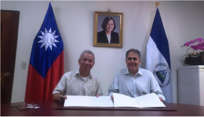
Imagen 10 Acta de patrocinio para el café en el exterior 2019