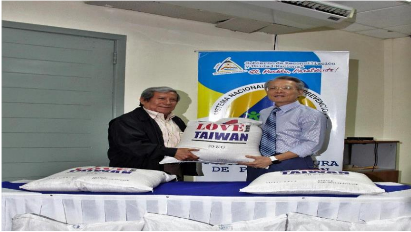
Imagen 7 Donación de arroz 2019