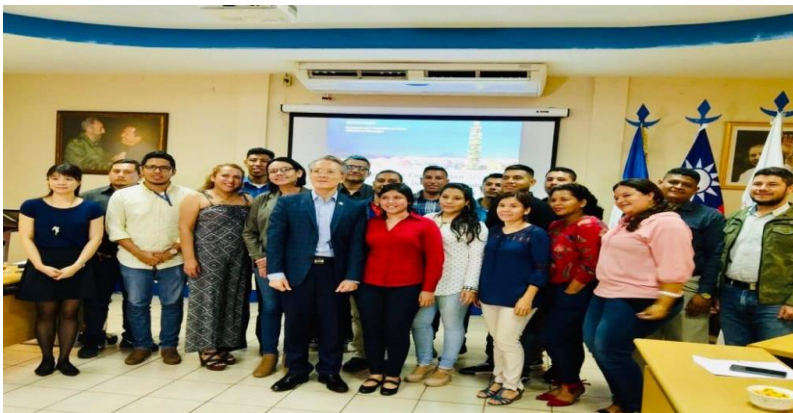
Imagen 9 Docentes viajan a Taiwán 2019