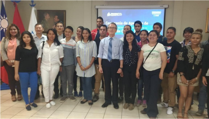
Imagen 1 Curso de chino mandarín 2018