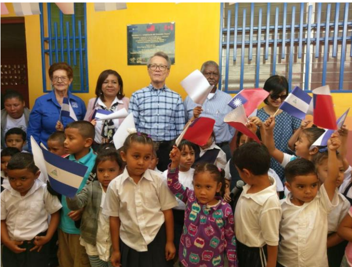
Imagen 2 Preescolar Estelí 2018