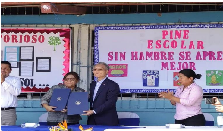
Imagen 8 proyecto merienda escolar 2019