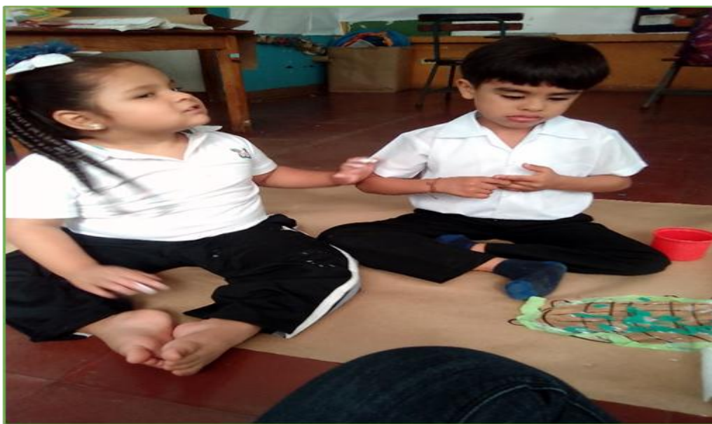
Foto 1. Estudiantes de educación inicial realizando actividad manual.