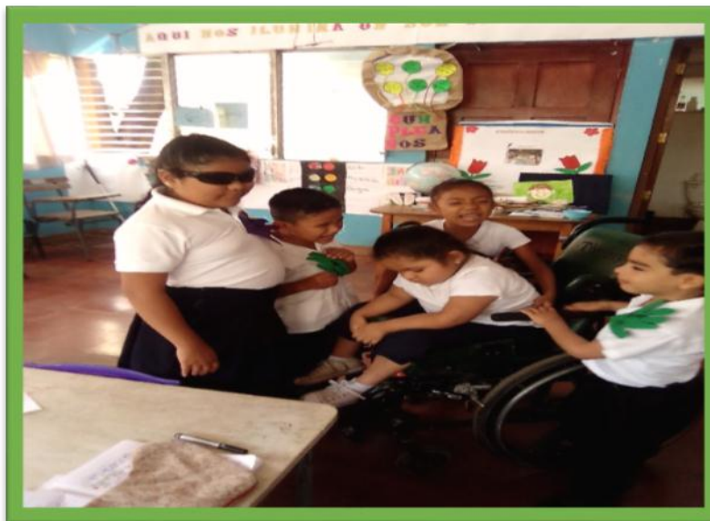
Foto 4. Niños del área de discapacidad visual de la Escuela Especial Melania Lacayo Cuadra.