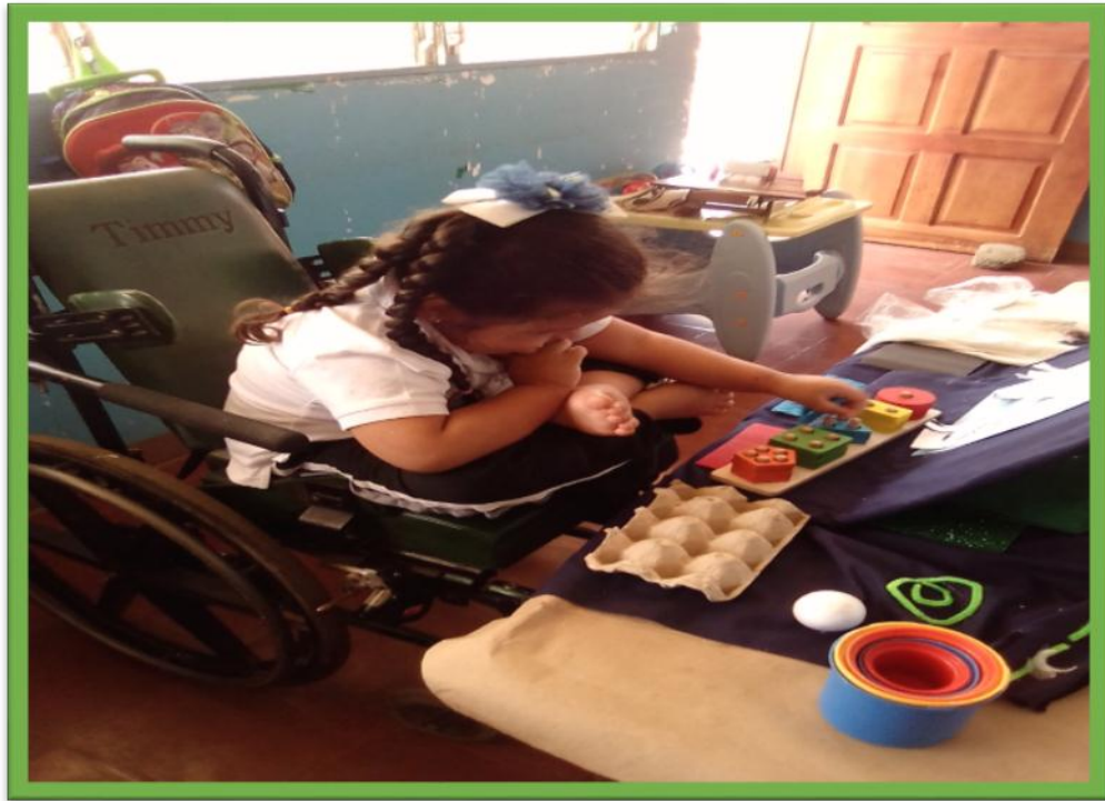
Foto 3. Estudiante con discapacidad múltiple, sacando piezas juego didáctico de ensarte.