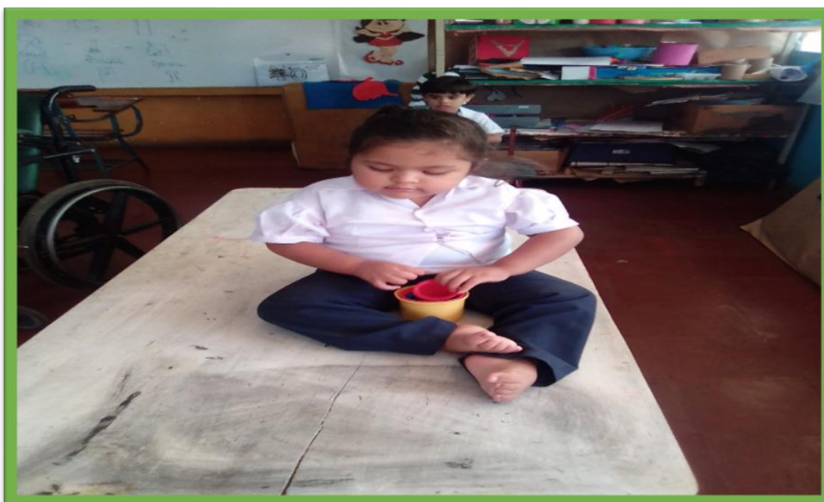
Foto2. Estudiante con discapacidad múltiple, en actividad de sacar recipientes de diferentes tamaños, para mejorar la precisión de sus movimientos manuales.