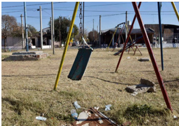
Imagen 3: Espacios Públicos degradados.

En este punto es importante profundizar en el concepto de segregación visto desde el urbanismo.