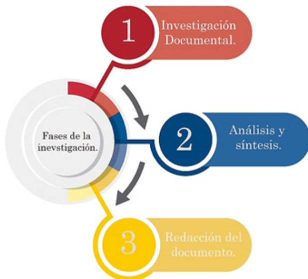
Imagen 1: Esquema Metodológica.

en el desarrollo de barrios segregados, estrategias y criterios de intervención, entre otros.