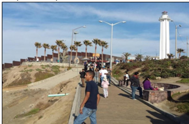
Imagen 3: Zona norte del malecón, Tijuana, al fondo el muro fronterizo con E.E. U.U.

A continuación, presentamos casos de estudio de intervenciones urbanas en Latinoamérica con el objetivo de mejorar la calidad de vida de sus habitantes, con el fin de evidenciar la importancia