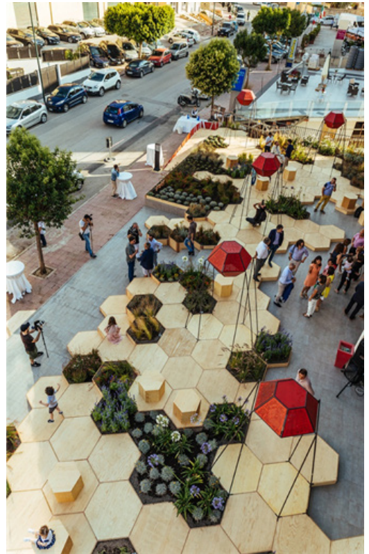
Imagen 2: Interacción de usuarios en el espacio urbano.

En la actualidad muchos centros urbanos experimentan desequilibrios que exponen estas dos condiciones en las que se puede encontrar el espacio público, esto como resultado de un desarrollo polarizado de la ciudad. Por eso se observan zonas con aumento y concentración de riquezas y un entorno urbano de mayor calidad que se adapta a las condiciones óptimas de vida de un sector más pudiente de la sociedad, a su vez, este desarrollo asimétrico provoca muchas veces mayor marginación de zonas pobres, que generan barrios segregados donde se asientan las personas con menos posibilidades y donde se evidencia las condiciones desfavorables que viven muchos habitantes.