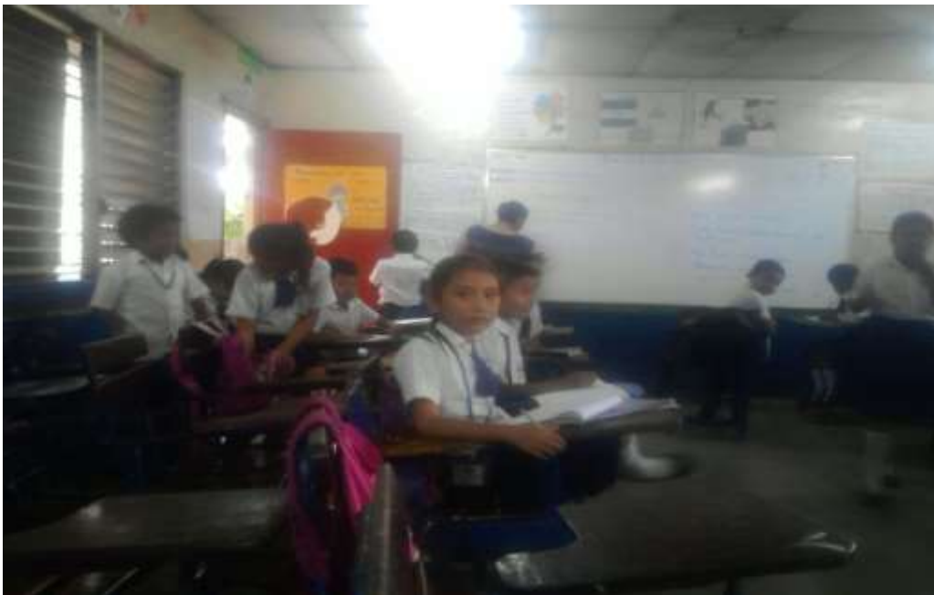
Anexo 9. Imagen 4. Maestra escribiendo en la pizarra y los estudiantes de pie.