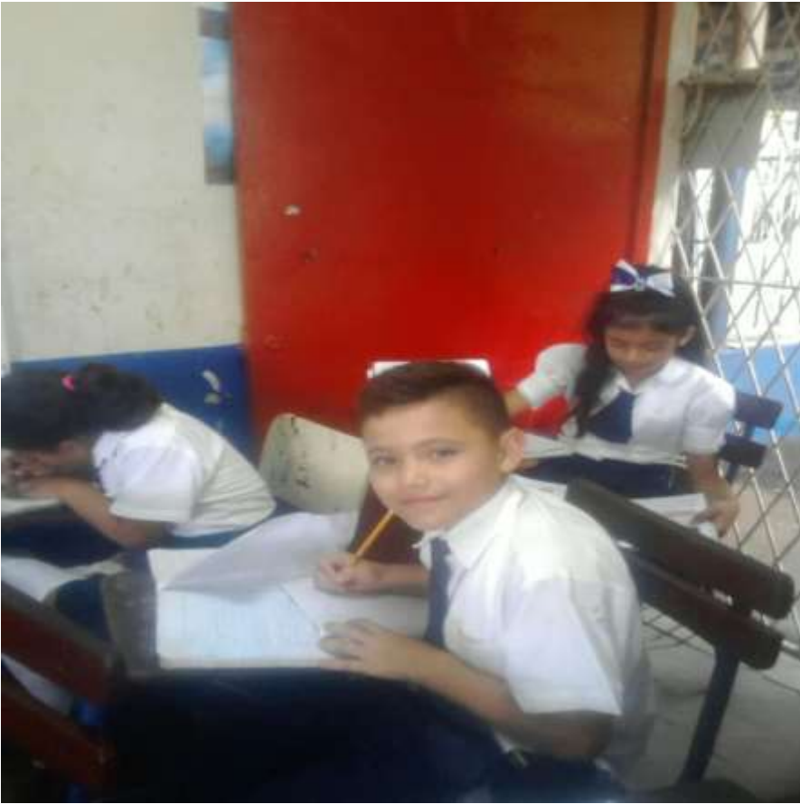
Anexo 10. Imagen 5.