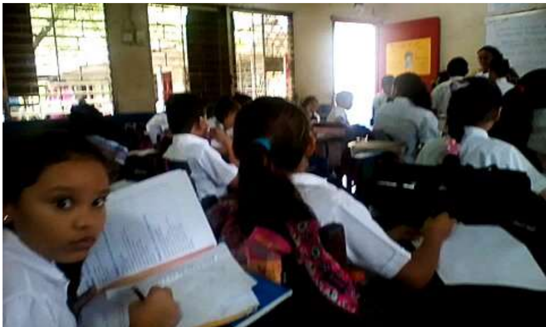
Anexo 7. Imagen 2. Estudiantes recibiendo clase de matemáticas.