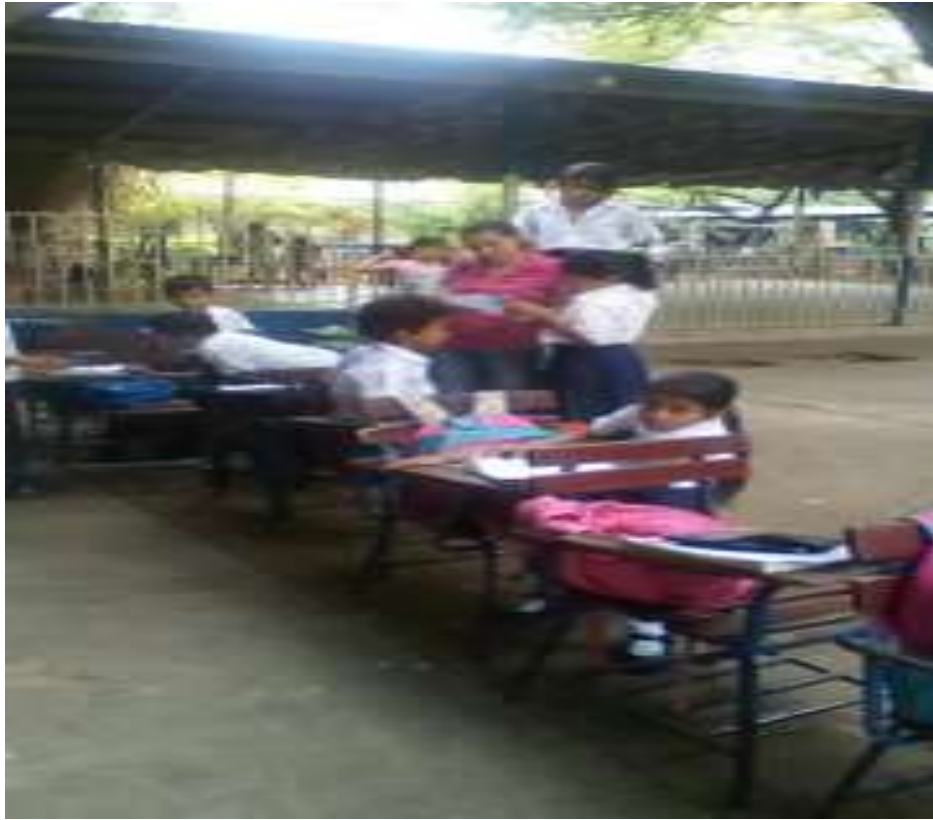
Anexo 8. Imagen 3. Fila fuera de la sección para realizar examen de Lengua y Literatura.