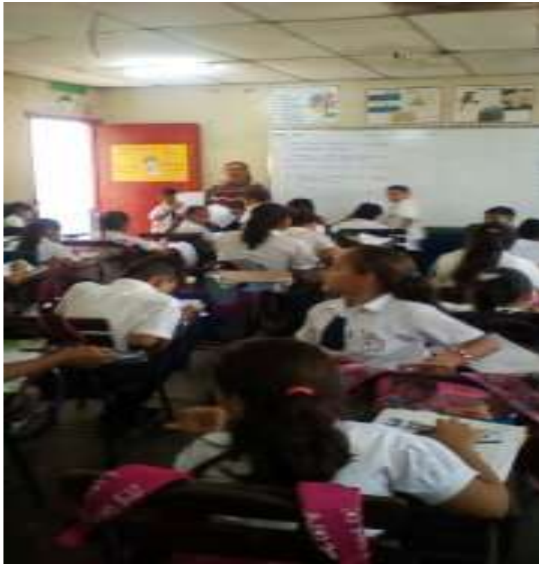
Anexo 6. Imagen 1. Realizando examen de matemáticas.