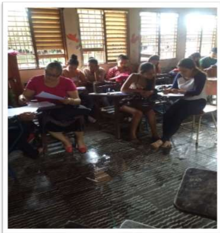
Figura 8: Estudiantes realizando la evaluación del contenido Naturaleza de la luz