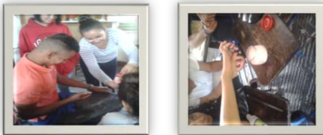
Figuras 6 y 7: Estudiantes realizando la práctica de laboratorio

estrategias, ya que estos están acostumbrados a clases teóricas y a transcribir la información sin analizarla, lo que conlleva a la indisciplina en el aula. Con esta práctica de laboratorio se logró que el estudiante comprobara de una manera concreta los conceptos y aplicaciones trabajadas en sesiones anteriores. En las siguientes Figuras se muestran evidencias del proceso en que los estudiantes realizaron la práctica experimental.