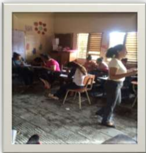
Figura 5: Investigadoras aplicando la propuesta de estrategia didáctica.

Es evidente la necesidad que se presenta en este centro en mejorar la calidad educativa donde los estudiantes deben convertirse en protagonistas de su aprendizaje para que puedan adquirir conocimientos que le sirvan en la vida.