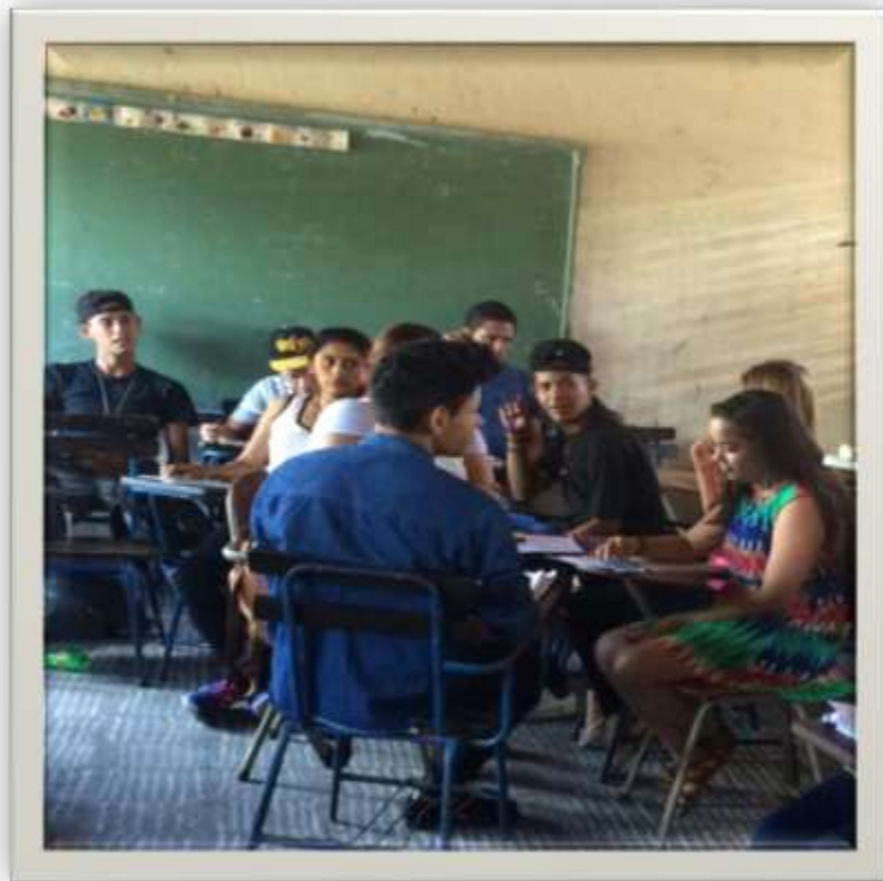
Estudiantes realizando la evaluación