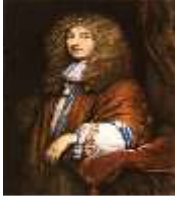
Christian Huygens (1629-1695)

se produce la sombra y cuando los corpúsculos rebotan en una superficie se produce el fenómeno de la reflexión.