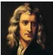
Isaac Newton (1642-1727)