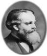
James Clerk Maxwell. (1837-1879)

Fue uno de los científicos más importantes del siglo XIX. Entre sus aportes está el haber mostrado la naturaleza electromagnética de luz. Donde afirmó que las ondas electromagnéticas de frecuencias inferiores a las que provocan la sensación de rojo se denominan infrarrojas y las de frecuencias superiores a las que producen la sensación de violeta, ultravioleta.