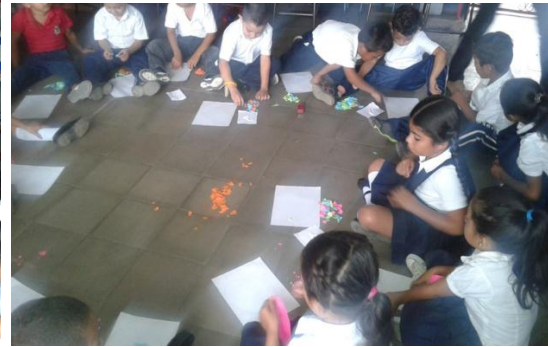
Niños y niñas realizando trabajo práctico