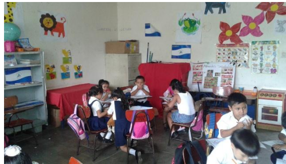
Niños y niñas realizando trabajos grupales