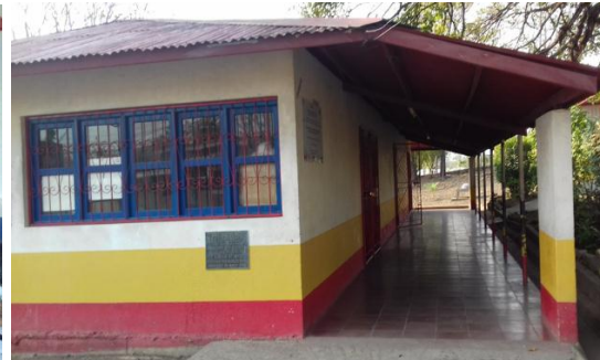
Infraestructura del preescolar