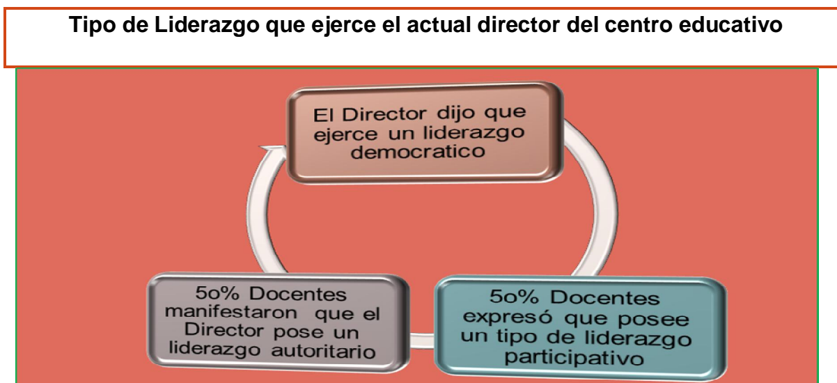
Grafico N° 1