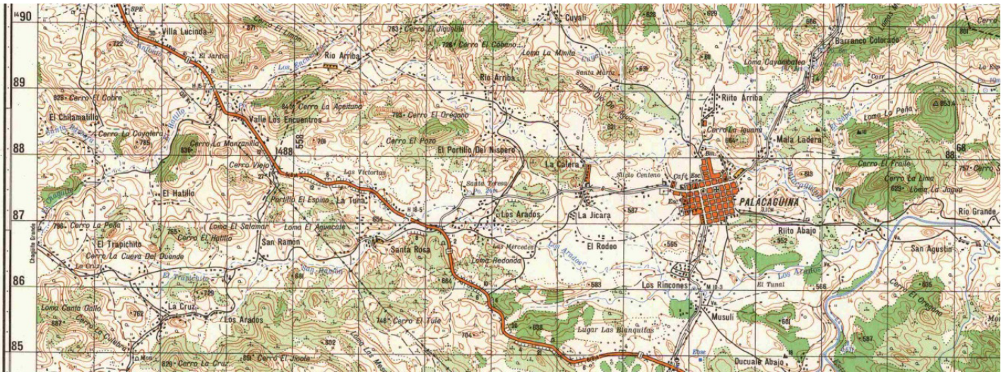
Figura N° 2: Extracto de mapa topográfico escala 1:50,000; Ubicación del muestreo en Río Palacaguina.

Los materiales utilizados para realizar el muestreo fueron envases de plástico, pinzas, malla de diámetro 500 \mu m, tamiz plástico de cocina doble, GPS- Garmin 60CSx, lápiz, lupas de 10x; microprocesador HI 9835, microscopios- estereoscópicos, guías de identificación de macroinvertebrados (BMWP – CR), bandeja de plástico, caja para guardar las muestras, rotulador de grafito, alcohol 70%, platos petry y agua destilada.