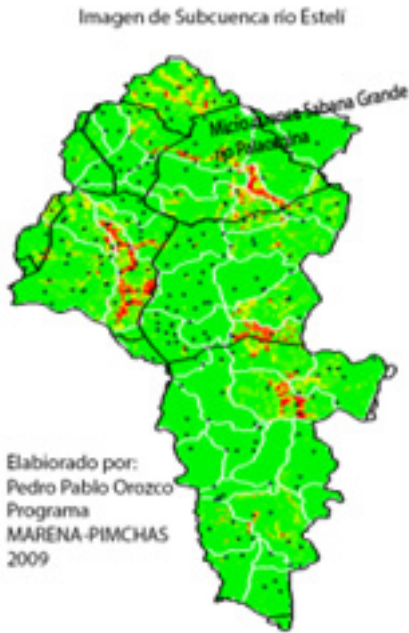
Figura N°1: Imagen de subcuenca del río Estelí

El muestreo de macroinvertebrados bentónicos se realizó en los meses de Abril y Noviembre del 2012, entre las 7:30 de la mañana y 3:30 de la tarde aproximadamente. Para realizar este muestro se utilizó una red de 150cm x 150cm con luz de malla de 500 \mu m, esta se colocaba 50 cm en la superficie del río y se removía el material un metro aguas arriba para capturar la mayor cantidad de macro invertebrados, también se revisaban las piedras, ramas y otros materiales. Los macroinvertebrados colectados fueron colocadas en alcohol al 70% y posteriormente se llevaron a la Estación Biológica El Limón de la Universidad FAREM –Sede Estelí para su identificación.