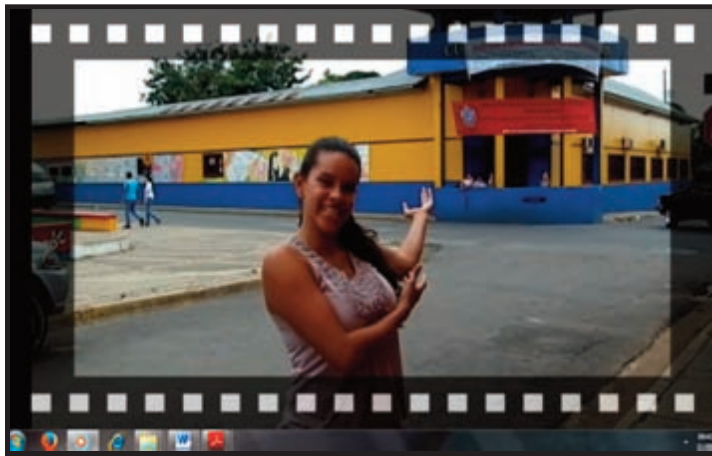
Joven estudiante describiendo el campus