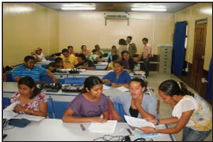
Estudiantes escribiendo sus conversaciones en grupos de tres