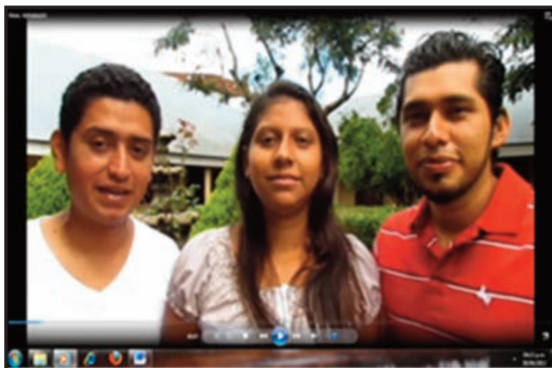
Un grupo de estudiantes filmando su primer video