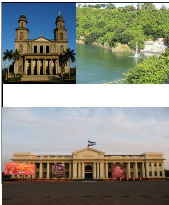
Imagen 1: vista de los sitios de Managua.

Además posee playas occidentales de fácil acceso, con hoteles y restaurantes en la ciudad con lujosas estructura que proveen confort y estabilidad a los visitantes, la modernización de esta ciudad fue a partir de los años 2000 con mayor incidencia en el 2007, todo ello ha favorecido al crecimiento del sector turístico en la región. Algunos sitios modernizados son el puerto Salvador Allende, La Avenida Bolívar, La Catedral de Vieja, el Palacio de la Cultura