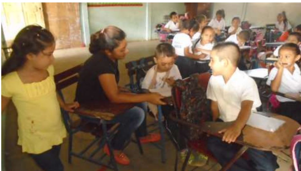
Imagen N° 1 Representa: Madre apoyando a su hijo.

Con la visita al aula de clase se pudo observar que no todos los niños y niñas asisten a clase, los padres que se presentan al aula son de los niños o niñas que van muy bien en las clases, con respecto a la ambientación del aula es muy pobre eso desmotiva a los niños, el día de la observación la docente no utilizo ninguna lámina solo el componedor para formar palabras y oraciones, el aula de clase no es adecuada para dar clase es muy oscura, no hay energía, los mobiliarios están bastante destruidos (pupitres, escritorio, persianas y puerta).