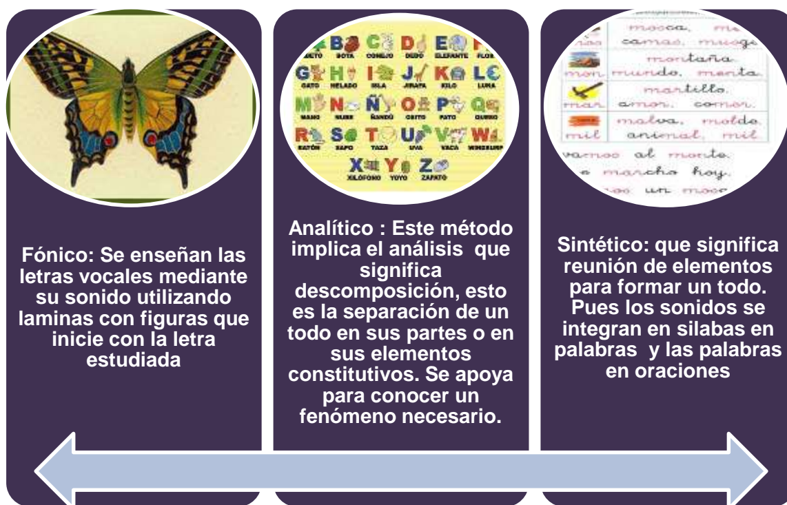
Lámina N° 1: Representa los pasos del método FAS.

La docente considera que si aplica el Método FAS y que hace uso de los pasos que corresponden, utilizando cada una de las herramientas auxiliares como el componedor individual y colectivo, además otros métodos variados de acuerdo a la necesidad del niño y niña como: La lectura, análisis de cuento, Método de decodificación para fortalecer el vocabulario.