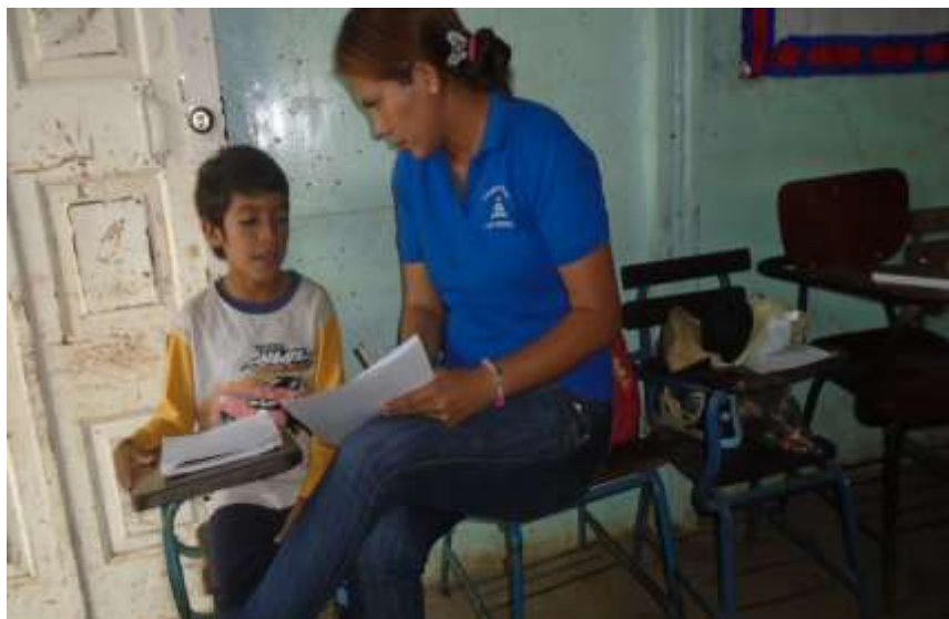
Imagen N° 2 Representa: Niño realizando hoja de aplicación dictado y lectura