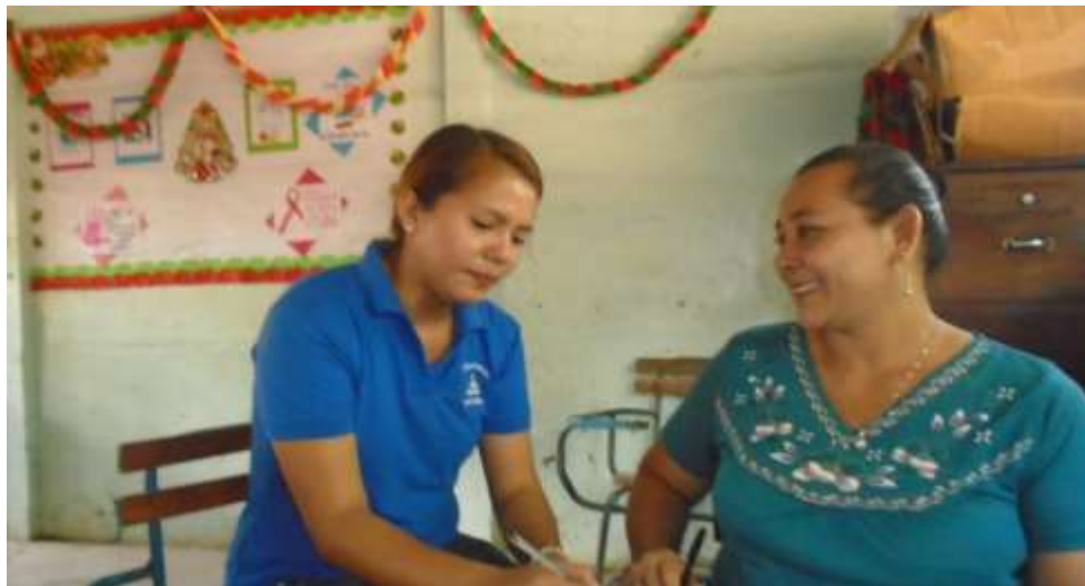
Imagen N° 5 Representa: Entrevistando a la docente.