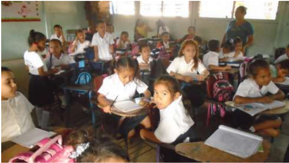
Imagen N° 4 Representa el aula de clase de los niños y niñas de primer grado B.