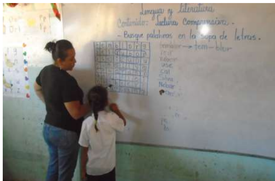
Imagen N° 3 Representa: Docente y estudiante encontrando palabras en la sopa de letra.

El detalle de utilizar estas estrategias metodológicas es con la finalidad de que el niño o niña se motive a participar en las mismas, cabe señalar que estas van de la mano con la presentación de una lámina, dramatización del cuento o poema, hojas de aplicación, dibujar y colorear, pero el uso de medios de enseñanza no se llevan a cabo en la clase de lengua y literatura. En la parte de la perspectiva teórica se encuentran algunas estrategias que pueden favorecer el proceso de enseñanza de la lectoescritura, cabe señalar que algunas de estas estrategias la docente ya las ha utilizado. También se muestran algunas sugerencias para decorar o ilustrar el aula de clase. (Palacios, 2013).