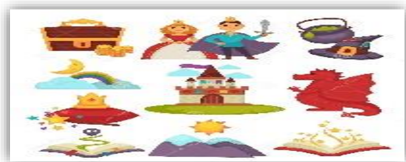
Ilustración 2 Personificación de Cuentos