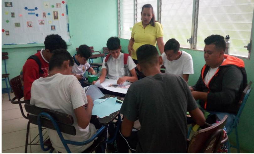
Foto 2. Seguimiento al desarrollo de la estrategia trabajo cooperativo sobre las its.