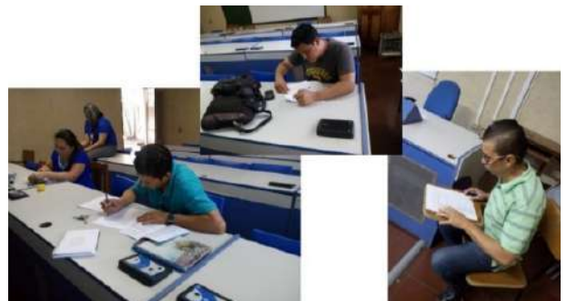
Ilustración 3. Docentes de Seminario de Formación Integral. Llenando Matriz de identificación

Estudiantes reconstruyen sus procesos de aprendizajes personales, familiares y educativos, realizando proyección positiva, presente y futuro de sus experiencias de formación integral. Destacan la importancia de la asignatura de Seminario de Formación