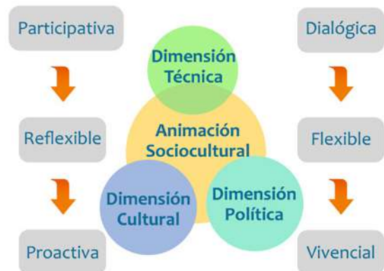
Ilustración 2. Metodología de intervención

La dimensión humanista o cultural (relacional y ética), se concreta en una concepción de la animación sociocultural: como praxis o práctica social.