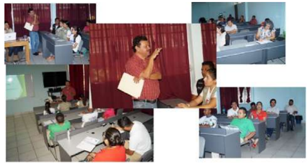
Ilustración 5. Conferencia Dialogada sobre Formación Integral Universitaria

Definición de los referentes teóricos y contextuales que forman parte de la Formación Integral universitaria para el proceso de reconceptualización.