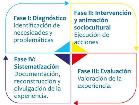
Ilustración 1. Fases de intervención

El proceso de intervención y animación sociocultural se organizó en 4 fases, las que determinaron el proceso de ejecución de la experiencia.