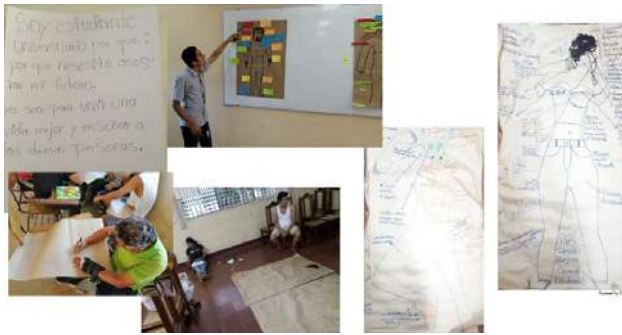
Ilustración 4. Taller de reflexión y debate con estudiantes