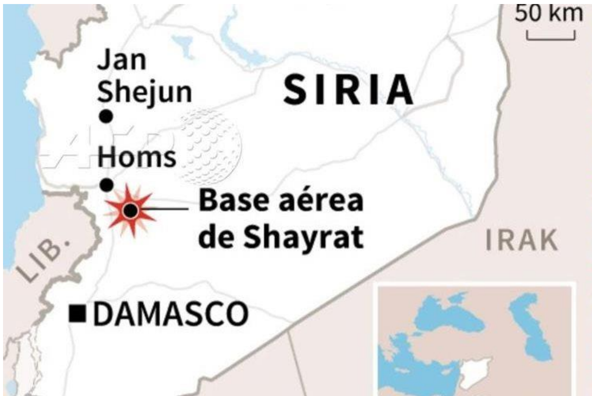
Anexo N° 7 Mapa muestra la ubicación de la base aérea siria atacada por EE.UU.