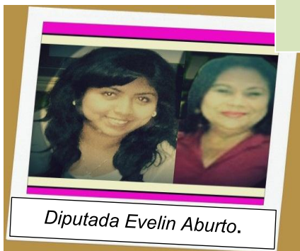
Diputada Evelin Aburto.