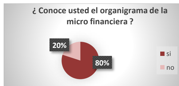
Gráfico No.1 Conocimiento del organigrama de CEPRODEL