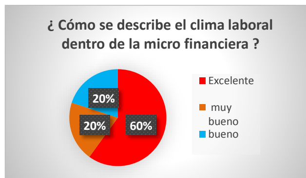
Gráfico N° 4. Comportamiento Organizacional.