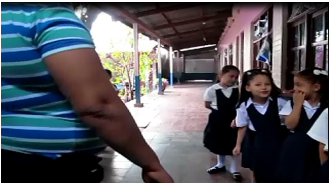
Ordenados para entrar y pasar sobre la alfombra del silencio