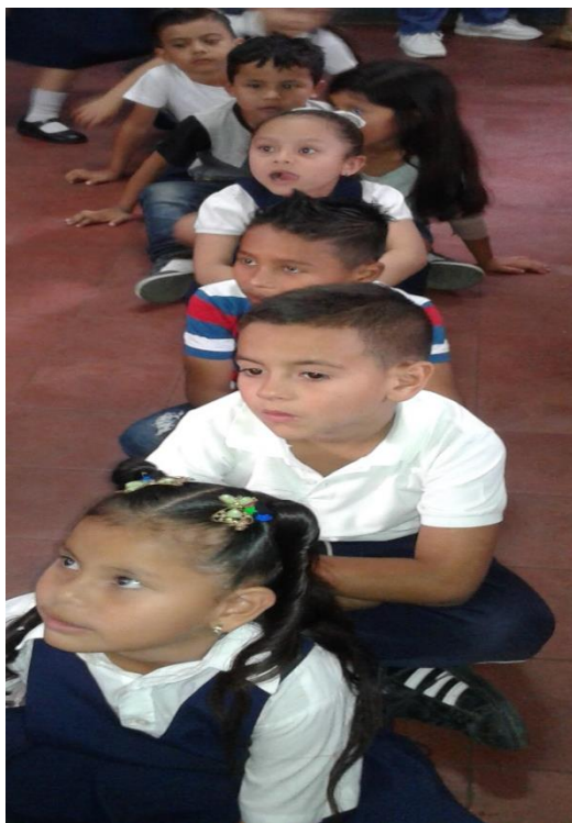
Foto 6 Centados en el piso en forma circular para desarrollar el contenido "vocal O"