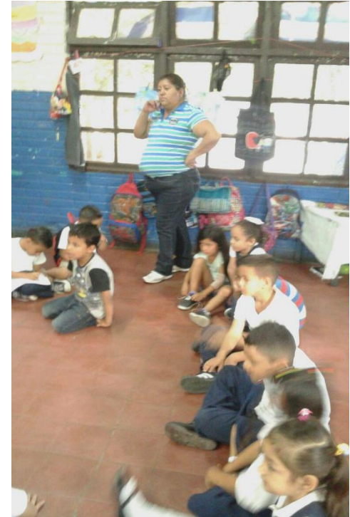
Foto 5 Desde otro angulo, foto los niños muy atentos escuchando el cuento.