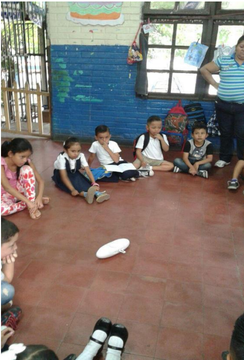
Foto 4 Atentos escuchando todo el grupo cuentos "El lobo y los 7 cabritos"