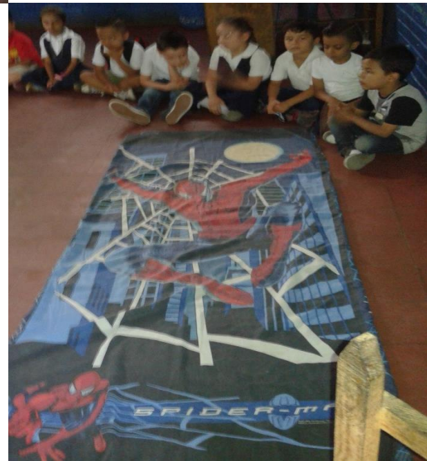
Foto 3 Ordenados para recibir la clase

La alfombra del silencio, aquí los niños y niñas habían pasado por la alfombra del silencio y ubicados en los lugares por la maestra guía, todos en completo silencio esperando indicaciones de la maestra.