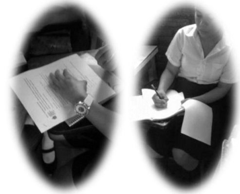
Figura 6: Valoración de los aprendizajes adquiridos

El 1 % de los estudiantes plantean que las estrategias estuvieron buenas pero faltó redacción y métodos para que funcionaran mejor y así pudieran aprender más, por tanto el otro 1 % expresó no aprender nada y no gustarle las actividades implementadas. Ver figura 6.