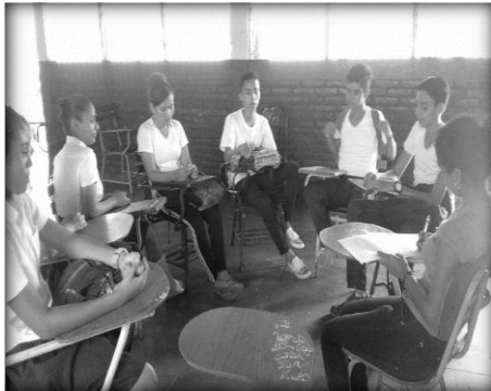
Figura 2. Grupo focal con los estudiantes

responsabilidad, ahorro, tomar luz natural por las persianas y así cuidar la naturaleza, según lo planteado creen necesario esta práctica de valores porque se solidarizan con la naturaleza, ahorran dinero al hacer uso racional de la energía y también están contribuyendo a tener menos gastos y hacer mejores ciudadanos. En la figura 2 se muestra un grupo focal.