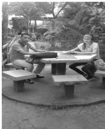
Figura 1. Realizando entrevista a docente

Según planteó el docente para continuar con la práctica de valores es necesario sensibilizar a las y los estudiantes para que puedan aprender más valores para el ahorro de la energía y llevarlos a la práctica a diario. Ver fig. 1.