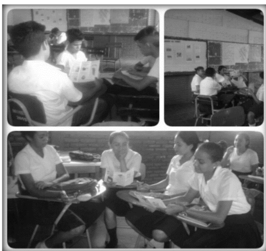
Figura 5: Elaboración de trípticos

En la última estrategia los trípticos, los estudiantes de décimo C, analizaron muy bien la información porque al realizar el seminario reflejaron el aprendizaje obtenido compartiendo los valores de conservación de la energía que más despertaron el interés en cada uno de ellos, también propusieron llevarlos a la práctica para que no se quedaran solo en el aprendizaje facilitado. Ver figura 5.