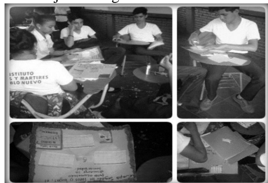
Figura 3: Realizando estrategia 1, eco calendario

La primera estrategia didáctica aplicada fue el eco calendario, las actividades implementadas en ésta ayudaron en el aprendizaje y conocimientos sobre cómo ahorrar energía y a la vez estas medidas como se pueden llevar a la práctica teniendo un conocimiento sobre valores, la misma facilitó un buen compartir entre compañeros, y fortaleció la comunicación, solidaridad y responsabilidad entre el grupo de trabajo. Ver figura 3.