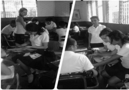
Figura 4: Aplicando la estrategia boletín ecológico

Posteriormente se aplicó la segunda estrategia (boletines ecológicos), los estudiantes se motivaron por aprender debido a que se les enseñó valores que ellos poco conocían o no los practicaban, esta ayuda a despertar interés en aprender valores para ahorrar energía y facilitó la integración, compañerismo, y ayuda mutua entre todos y todas. Ver figura.4.