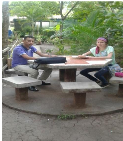
Figura 1. Realizando entrevista a docente

Según planteó el docente para continuar con la práctica de valores es necesario sensibilizar a las y los estudiantes para que puedan aprender más valores para el ahorro de la energía y llevarlos a la práctica a diario. Ver fig. 1.