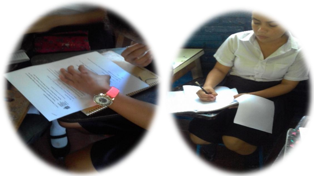
Figura 6: Valoración de los aprendizajes adquiridos

Con el fin de conocer la valoración de profesora, se le realizó entrevista, en la que expresa que las estrategias aplicadas están muy buenas y llamativas para brindar aprendizaje en valores de ahorro de la energía, pero que hizo falta un poco más de tiempo para desarrollar mejor las actividades, según él, los estudiantes aprendieron valores para el ahorro de la energía, porque después de las estrategias aplicadas reflejaron motivación y conocimientos los cuales fueron adquiridos mediante las actividades implementadas, el maestro dice estar de acuerdo con seguir motivando a los estudiantes con estas y otras estrategias, debido a que mira el interés de ellos por aprender. Para validar la estrategia se realizó la siguiente tabla. Ver tabla n° 2.