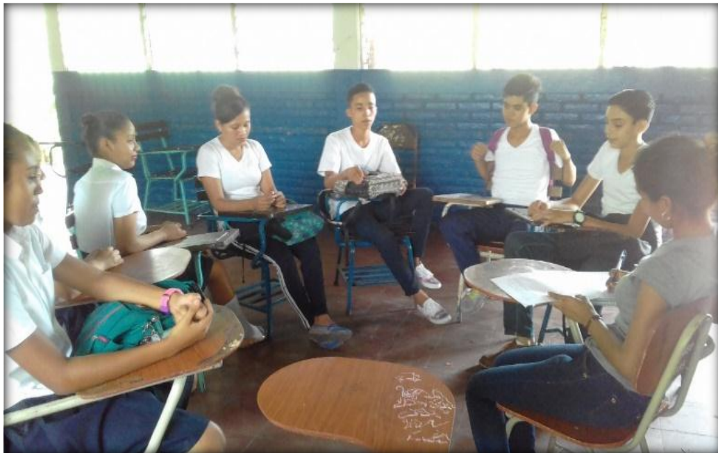
Figura 2. Grupo focal con los estudiantes

En los grupos focales realizados a los y las estudiantes expresaron que les gusta practicar valores el ahorro de la energía, como justicia, cuidado de la naturaleza, responsabilidad, ahorro, tomar luz natural por las persianas y así cuidar la naturaleza, según lo planteado creen necesario esta práctica de valores porque se solidarizan con la naturaleza, ahorran dinero al hacer uso racional de la energía y también están contribuyendo a tener menos gastos y hacer mejores ciudadanos. En la figura 2 se muestra un grupo focal.