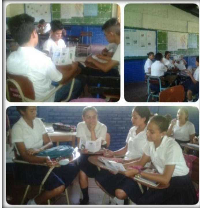
Figura 5. Elaboración de trípticos

Según Pimienta las estrategias de enseñanza-aprendizaje son instrumentos de los que se vale el docente para contribuir a la implementación y el desarrollo de las competencias de los estudiantes, por ende las estrategias aplicadas fueron de enseñanza-aprendizaje porque cumplieron esta teoría, permitiendo fortalecer los conocimientos sobre valores para el ahorro de la energía.