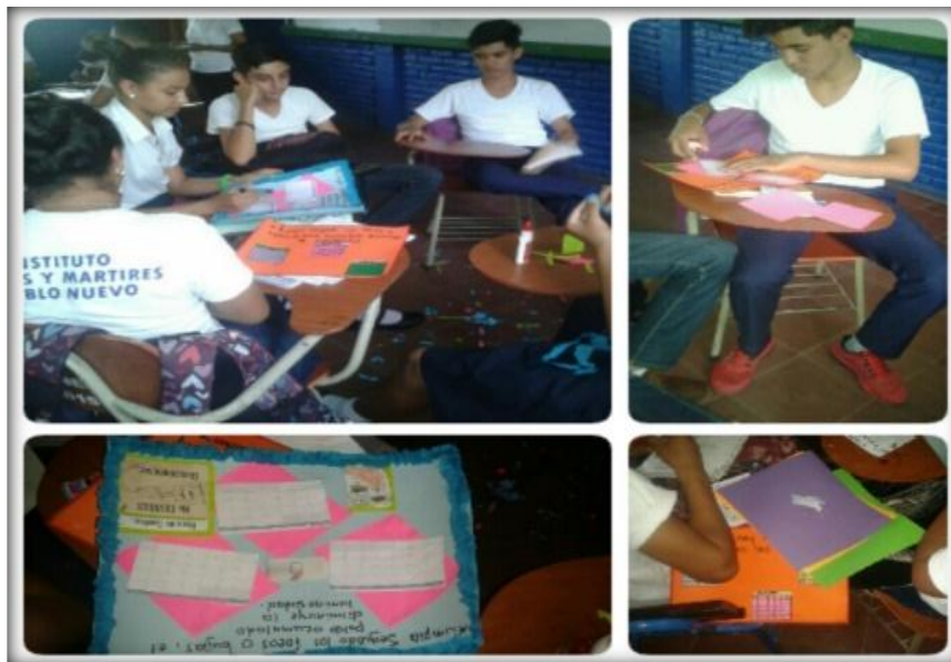
Figura 3 Realizando estrategia 1, eco calendario

La primera estrategia didáctica aplicada fue el eco calendario, las actividades implementadas en ésta ayudaron en el aprendizaje y conocimientos sobre cómo ahorrar energía y a la vez estas medidas como se pueden llevar a la práctica teniendo un conocimiento sobre valores, la misma facilitó un buen compartir entre compañeros, y fortaleció la comunicación, solidaridad y responsabilidad entre el grupo de trabajo. Ver figura 3.