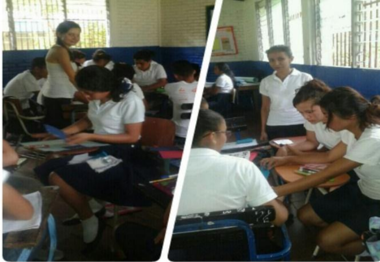
Figura 4. Aplicando la estrategia boletín ecológico

En la última estrategia los trípticos, los estudiantes de décimo C, analizaron muy bien la información porque al realizar el seminario reflejaron el aprendizaje obtenido compartiendo los valores de conservación de la energía que más despertaron el interés en cada uno de ellos, también propusieron llevarlos a la práctica para que no se quedaran solo en el aprendizaje facilitado. Ver figura 5.