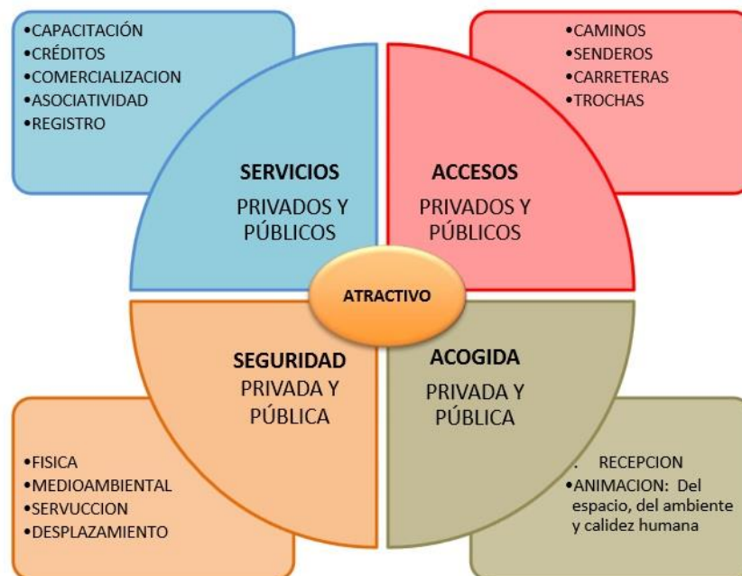
Gráfico # 3 Modelo integral de atractivos turísticos