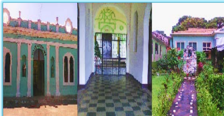
Fuente: Fotografía N°1, tomada por una de las investigadoras, 02/12/2016, Hogar San Antonio de Masaya.

el Hospital Rafaela Herrera, después se llamó Hilario Sánchez, mientras era hospital las que atendían eran las hermanas Josefina, después paso hacer bodega del MINSA porque se creó el nuevo hospital de Masaya,