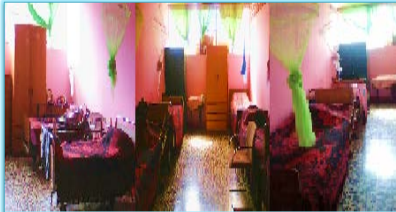
Fuente: Fotografía N°2, tomada por una de las investigadoras, 02/12/16. Habitaciones de las Adultas Mayores.

Posee un sistema de cuartos múltiples (5 habitaciones comunes dividiendo a las/los Adultos Mayores de acuerdo a su sexo y dependencia), con baños y servicios higiénicos integrados, armarios y camas