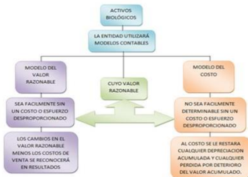
Figura No. 2

Modelos para la medición de activos biológicos, se muestran las diferencias entre cada modelo para ayudar a determinar cuál de estos se añadiera a las políticas contables de la empresa. (Véase sección 34.4, 34.8 la NIIF para Pyme)