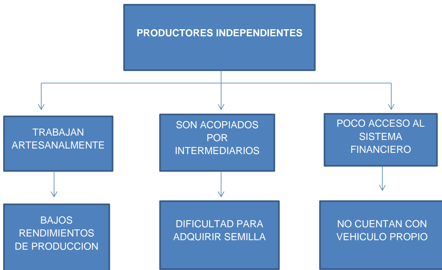
Gráfico Nº 2

El municipio de Santa Lucía, departamento de Boaco cuenta con aproximadamente 350 pequeños productores de frijol rojo, de los que aun trabajan de manera independiente (aproximadamente son el 30%) estos no han logrado una transformación socioeconómica a través de la producción de frijol rojo, ya que estos labran la tierra de manera artesanal, al igual que se les hace difícil adquirir la semilla para los ciclos productivos ya que muchas veces lo hacen a través de ellos mismos y de esta forma no logran mejorar las semillas y por ende sus rendimientos de producción son bajos, por lo que estos tienen poco acceso al sistema financiero debido a las trabas que el sistema les presenta al adquirir un financiamiento para su producción, la mayoría de estos productores no cuentan con vehículo propio lo que significa que estos se les dificulta transportar su producción al mercado nacional o a otros clientes y por lo tanto estos productores desde sus parcelas esperan vender el rubro a intermediarios, el cual estos intermediarios acaparan la mayoría de las ganancias y los productores solamente logran producir para sus costos y el consumo diario.