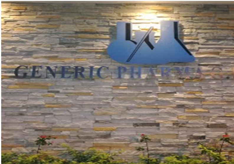
Parte del costado Sur de la Empresa