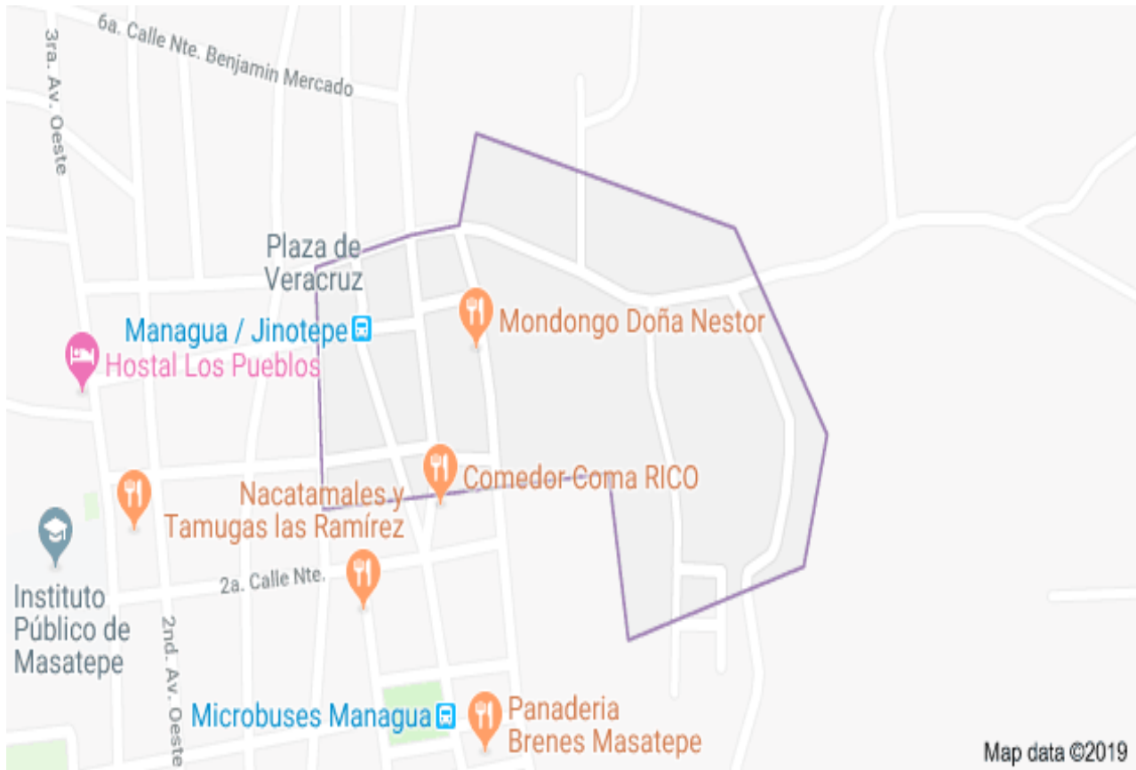
Figura. 1 Caracterización del municipio