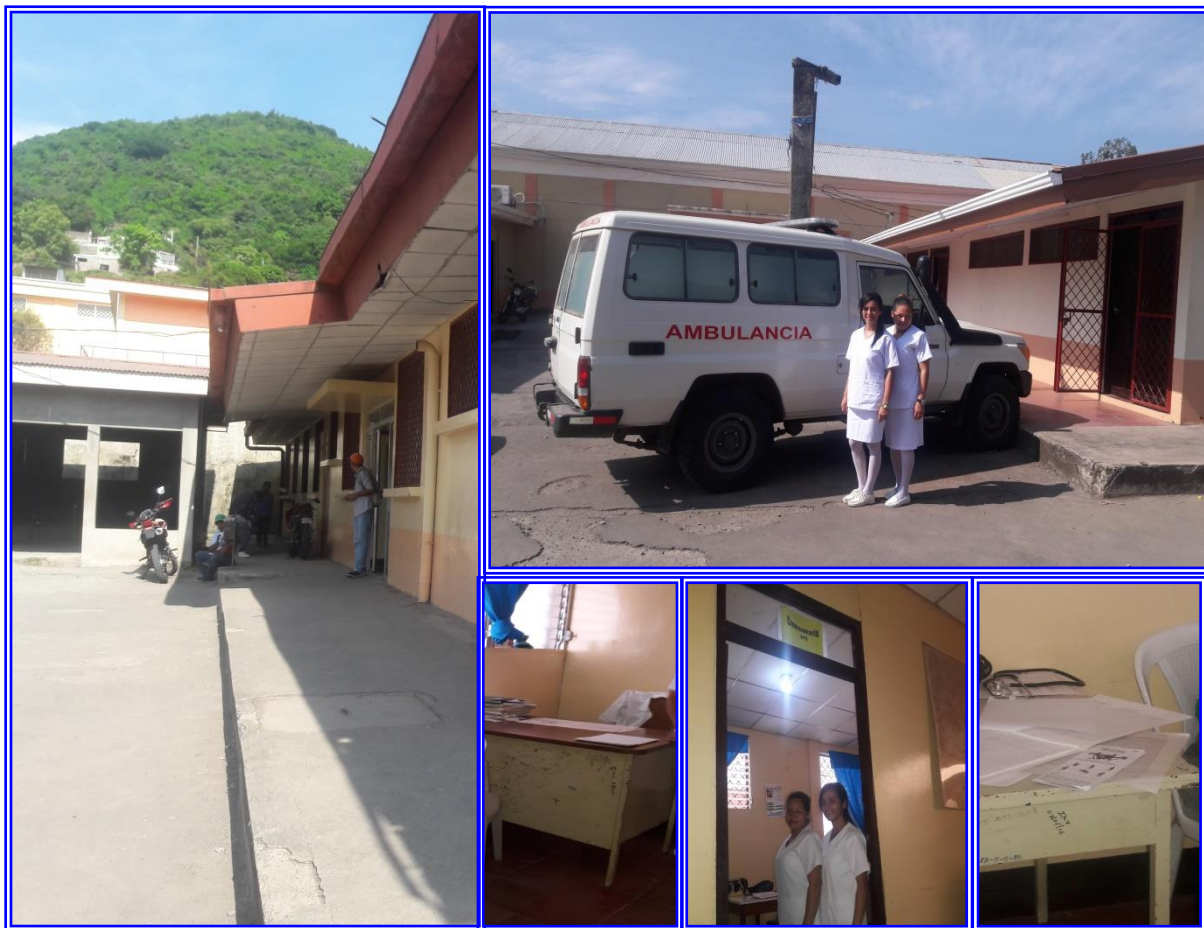
Ilustración 1 Estructura Física del Local del Policlínico Trinidad Guevara Narvárez y el Consultorio#1