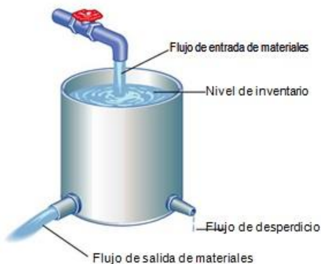
Figura 1.1 (Krajewsky et al., 2008, pág. 374)