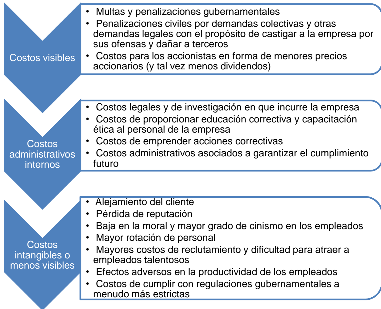
Figura 3.3. Thompson y Gamble, 2012, pág. 304

Costos en que incurren las empresas cuando se descubren malas conductas éticas