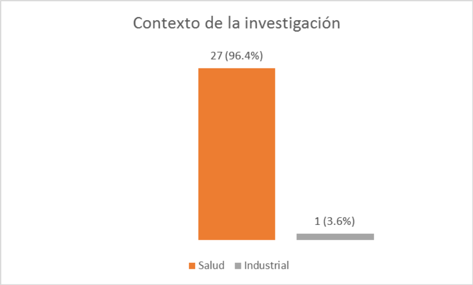
Gráfico no. 2. Líneas de investigación de tesis de Administración en Salud.