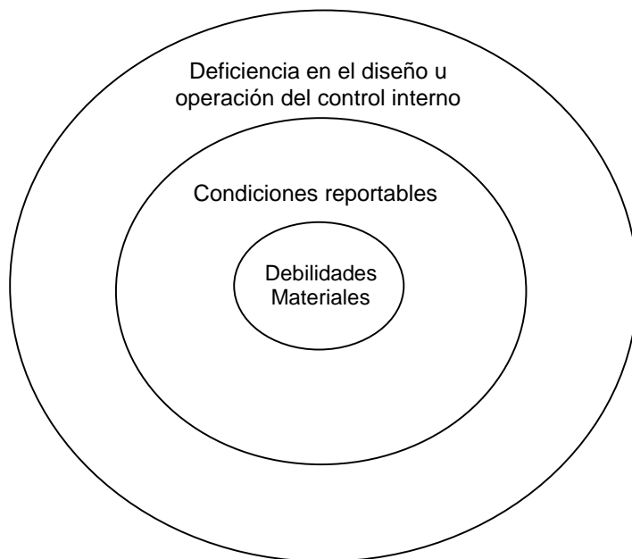
FIGURA 2. Relación entre deficiencias del control interno

Fuente: Un enfoque integral, O. Ray Whittington, McGraw Hill, pág. 194