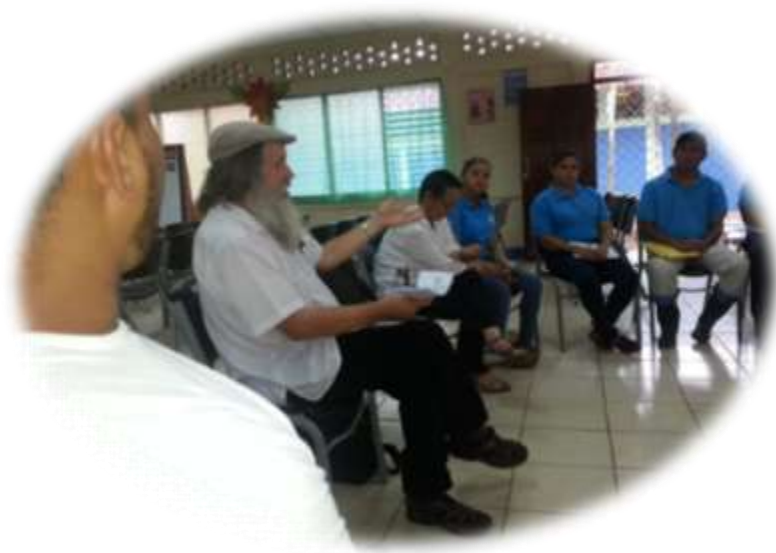
Ilustración: 4, Docentes participando en dinámica de cooperación genuina realizada por el facilitador Herman Van de Velde.