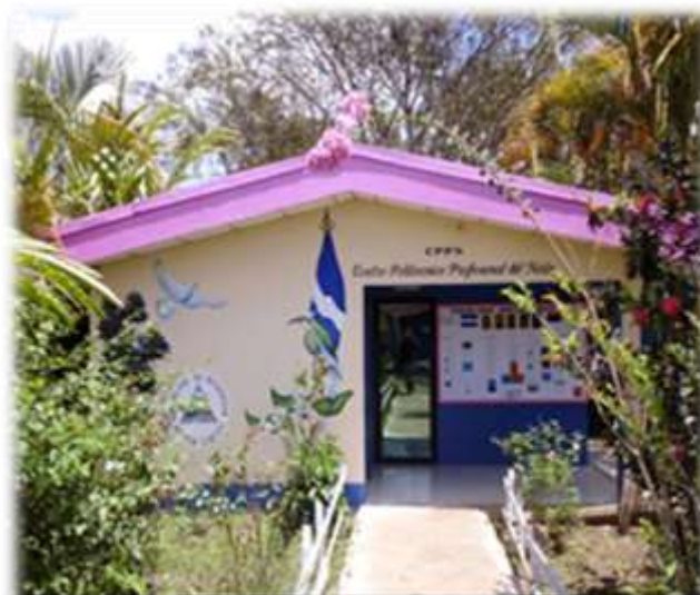
Tecnológico Nacional Agropecuario de Jalapa

Jalapa es considerada una ciudad muy productiva por contar con terrenos fértiles. Constituye uno de los pilares de la economía, y por eso es necesario formar, Técnicas/os Agropecuarias/os; Veterinarias/os y Técnicos en Administración Agropecuaria, con principios y valores que le permitan convivir en armonía con la sociedad y el ambiente,