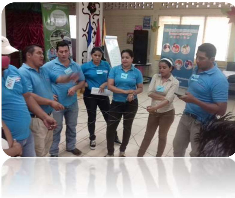
Ilustración 2: Docentes participando en dinámica sobre educación incluyente evaluación de los aprendizajes.