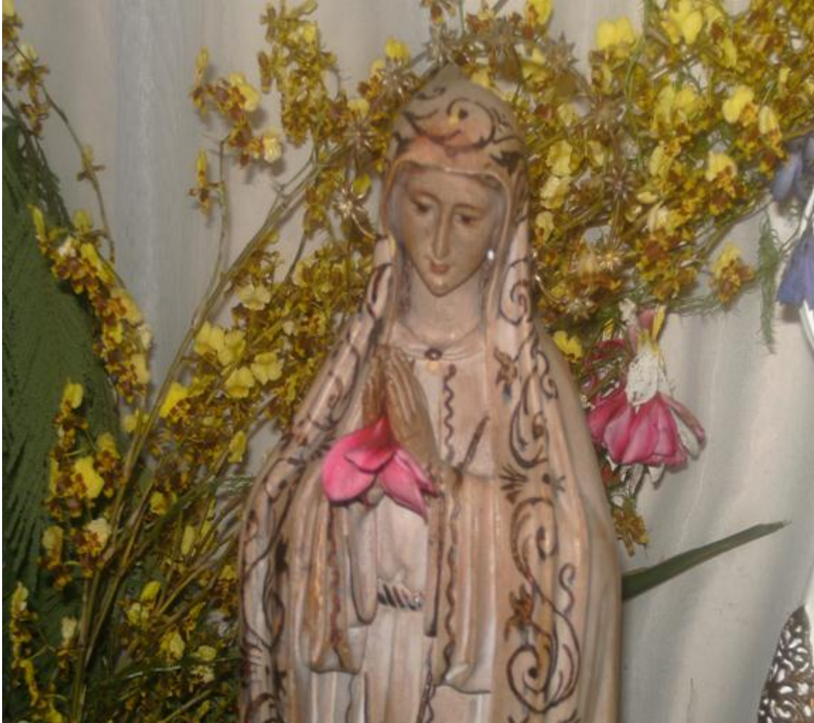
Virgen de La Merced, Patrona de los Totogalpinos.