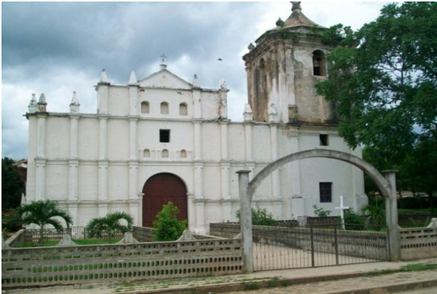
Iglesia Santa María Magdalena, de Totogalpa, Patrimonio Cultural de la Nación.