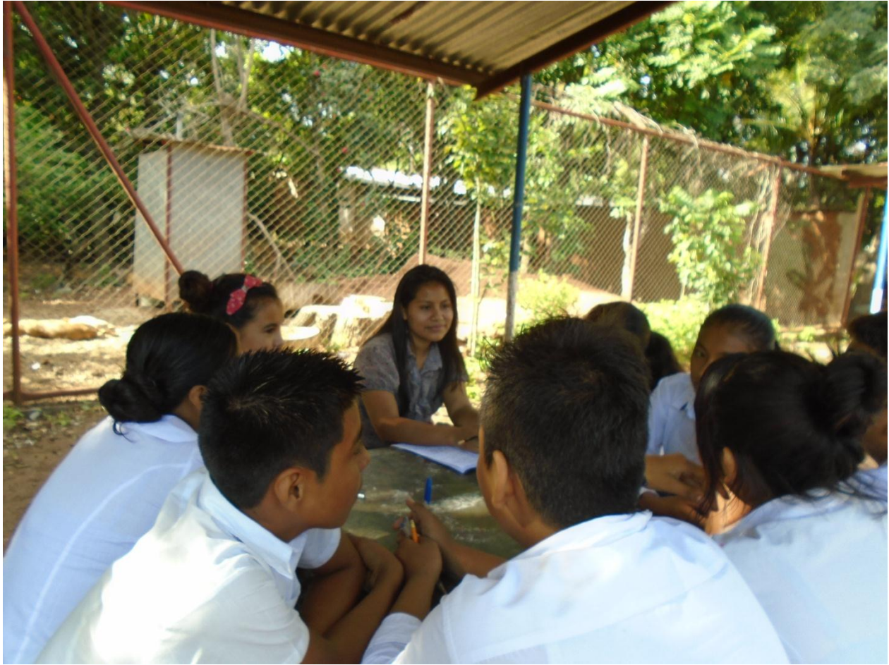
Estudiantes de FAREM-Estelí realizando grupo focal con estudiantes de noveno grado.