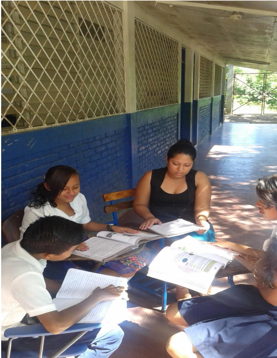
Estudiantes de FAREM-Estelí brindando información a estudiantes sobre mitos, leyendas y creencias de Totogalpa.