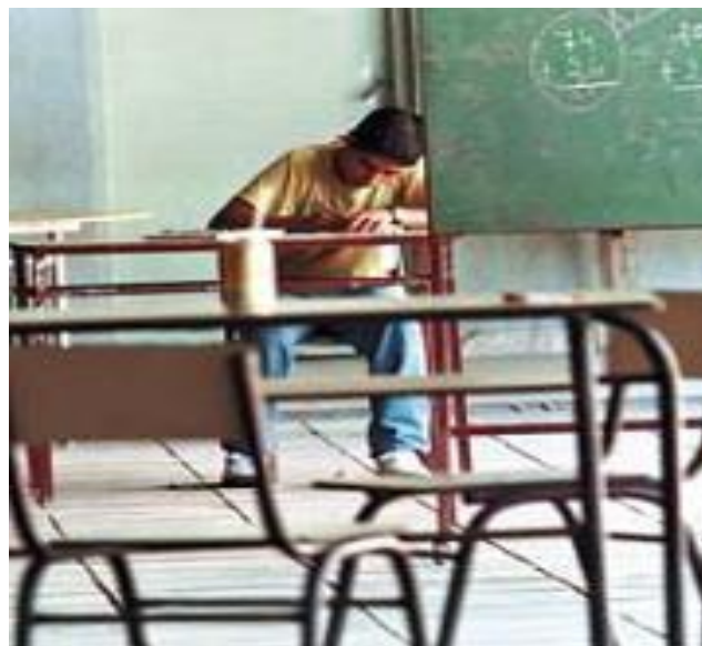
Aulas vacías a causa de la deserción.