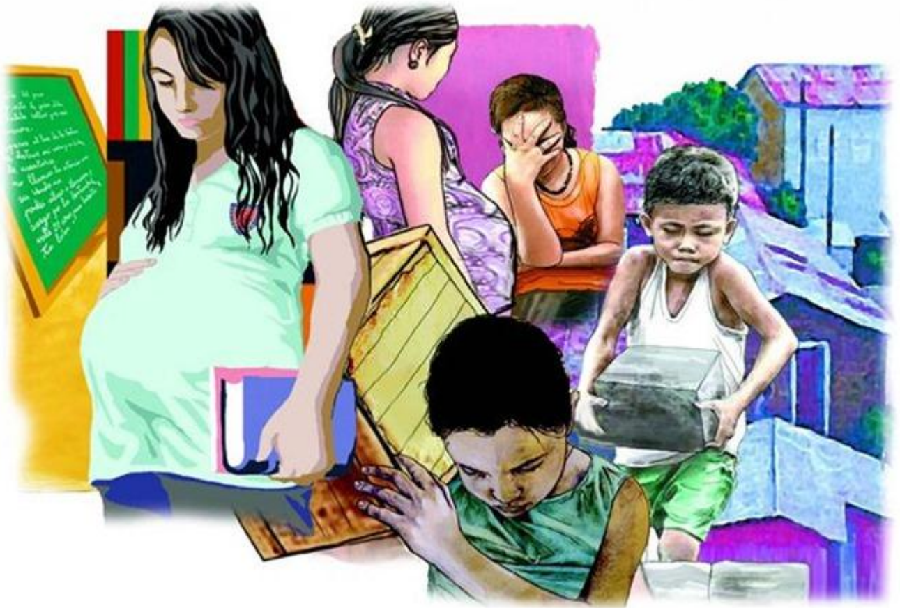
Jóvenes embarazadas que abandonan sus estudios.