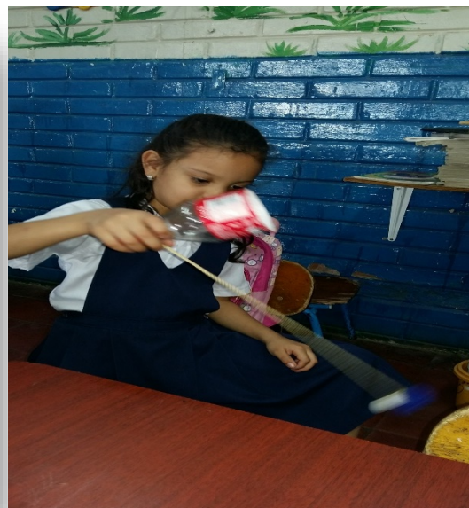
Niños y niñas participando en las diversas actividades de elaboracion de materiales didacticos