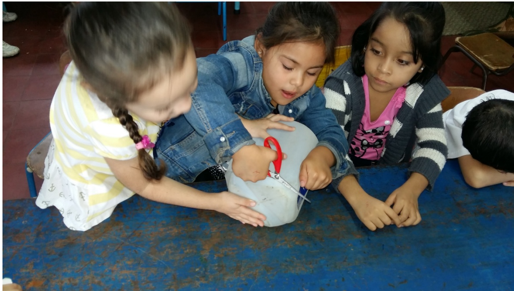
Niñas recortando una botella de galon para realizar el material, Taponos locos