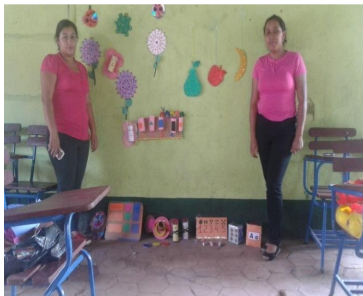
Ambientación del corredor para desarrollar actividades