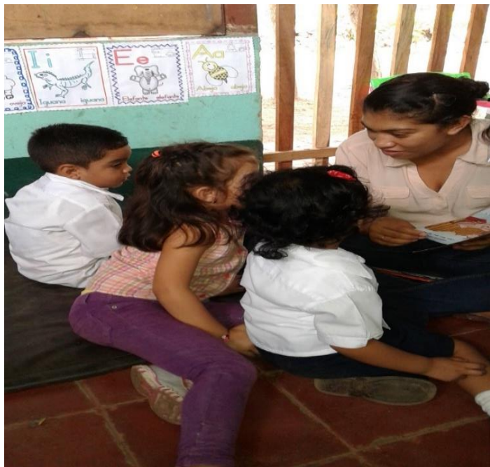
Contando cuentos a los niños/as