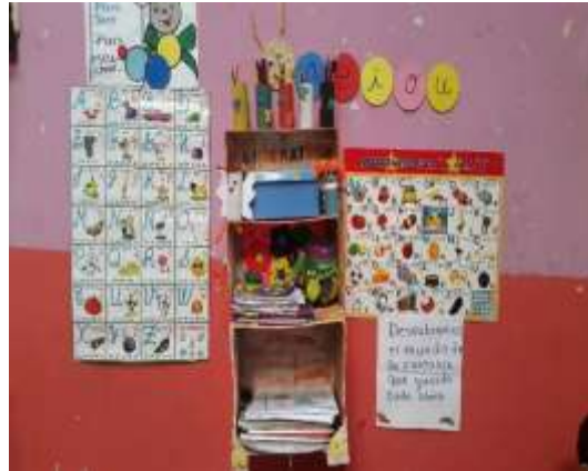
Imagen de escenario No. 2