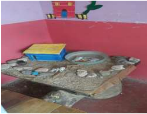
Imagen de escenario No. 5