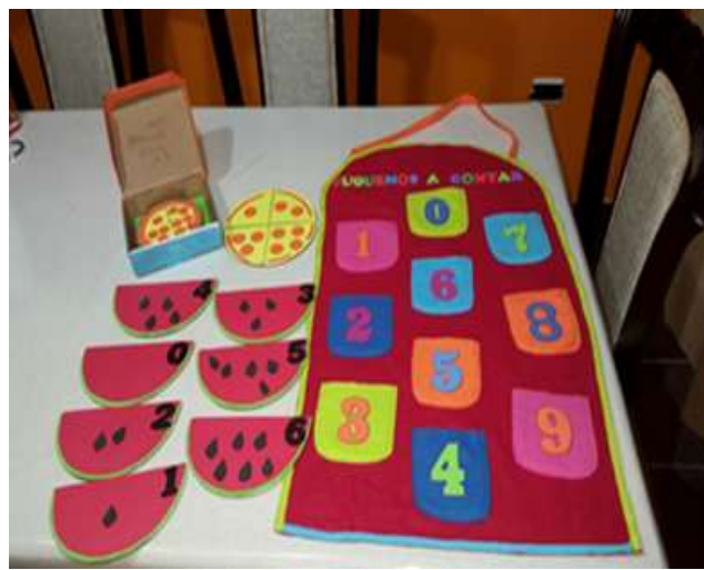
Imagen de escenario No. 7