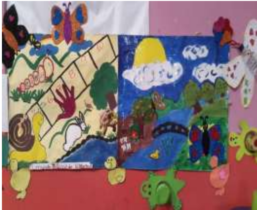
Imagen de escenario No. 1