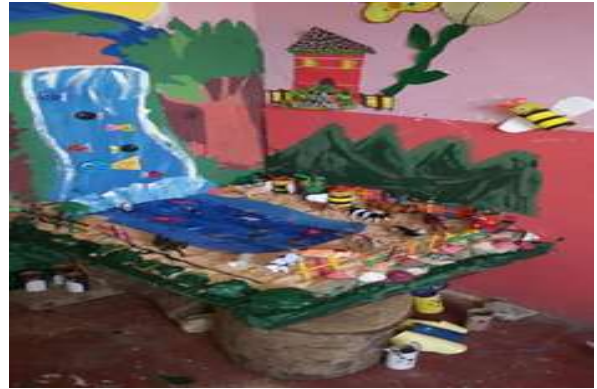
Imagen de escenario No. 6