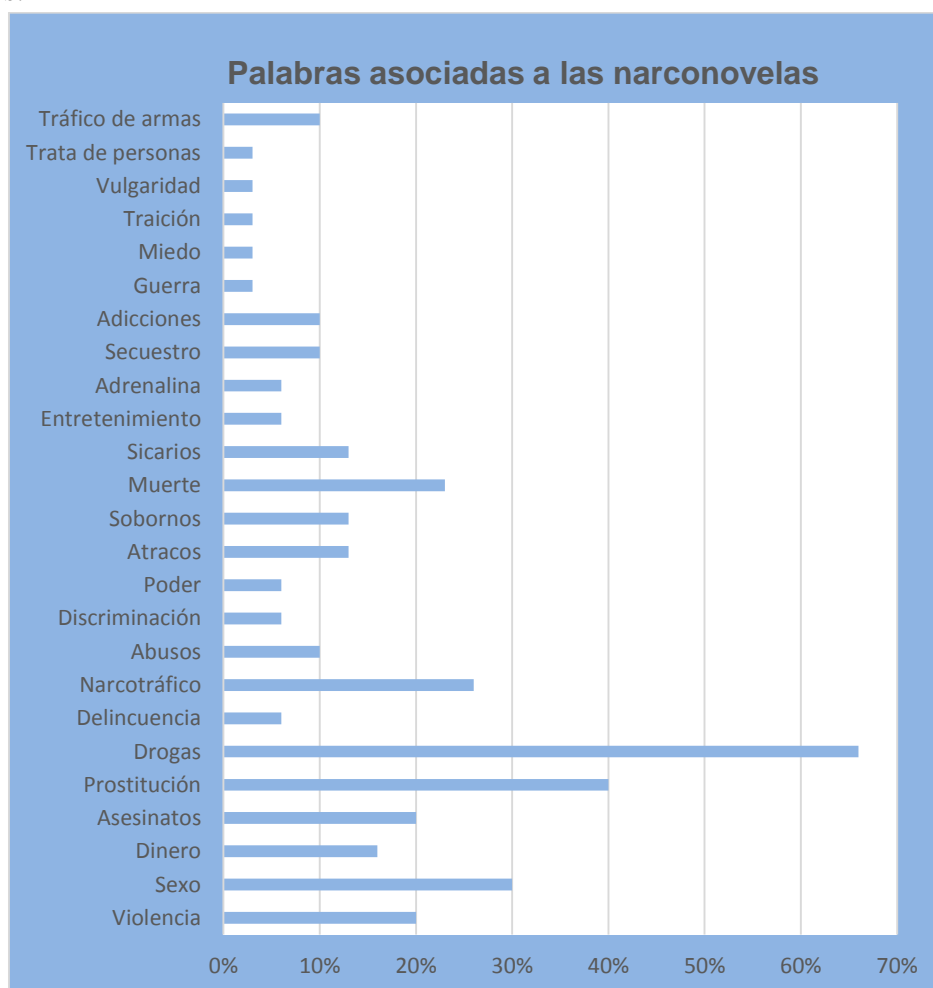
Gráfico 1 Palabras Asociadas a las Narconovelas.

En el estudio realizado se encontró que los adolescentes del Instituto Nacional Francisco Luis Espinoza tienen una percepción de cierta manera acertada sobre las narconovelas, donde reconocen aspectos negativos de este tipo de programación, los cuales han atraído su atención y de manera inconsciente están siendo influidos de tal manera que han incorporado conductas propias de los personajes en donde la percepción que tienen de ellas es producto de un esquema mental creado a partir de la temática y de igual manera de las experiencias vividas por los estudiantes.