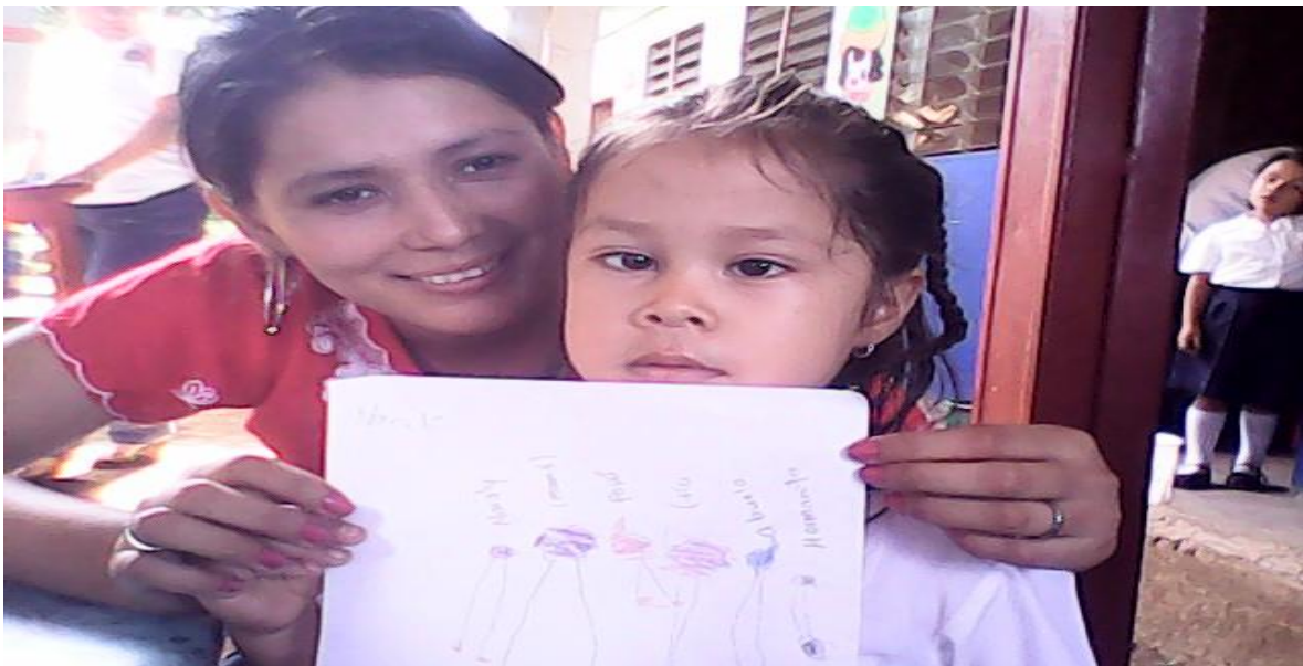
Dibujando su familia.