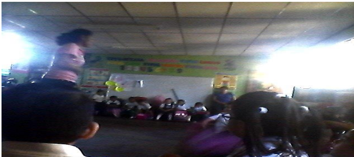
Naraly al final del salón