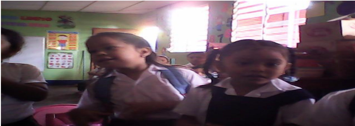
Naraly feliz con el canto de las manitas