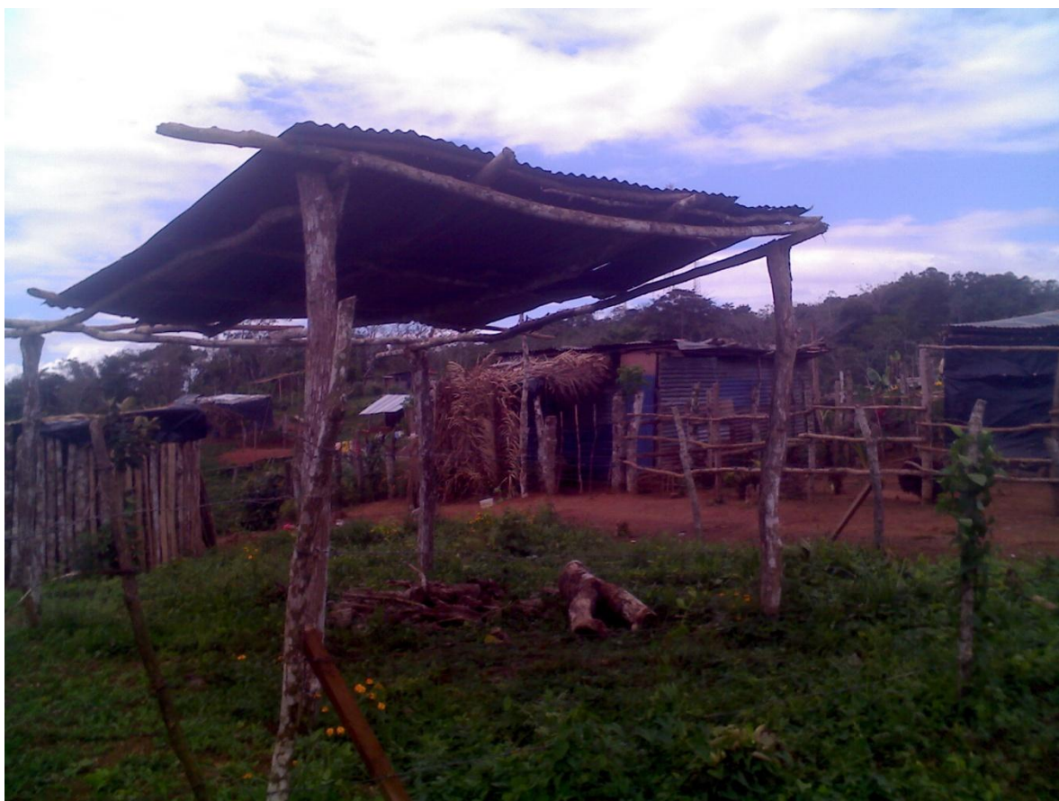
Ilustración 2 Barrio 19 de Julio

Hay factores de atracción que tienen que ver con la percepción de los migrantes, aunque los factores de empujen sean económicos o bélicos, el sitio de llegada puede estar ligado a una propaganda turística, que venda a Rio San Juan como un sitio bonito, perfecto para empezar una nueva vida.