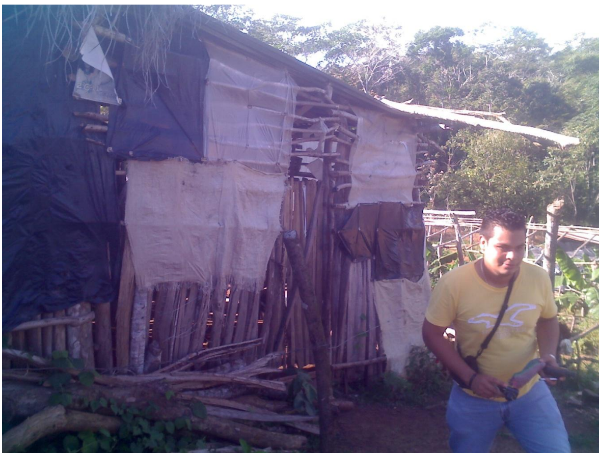
Asentamiento 19 de Julio, San Carlos 16-02-2012