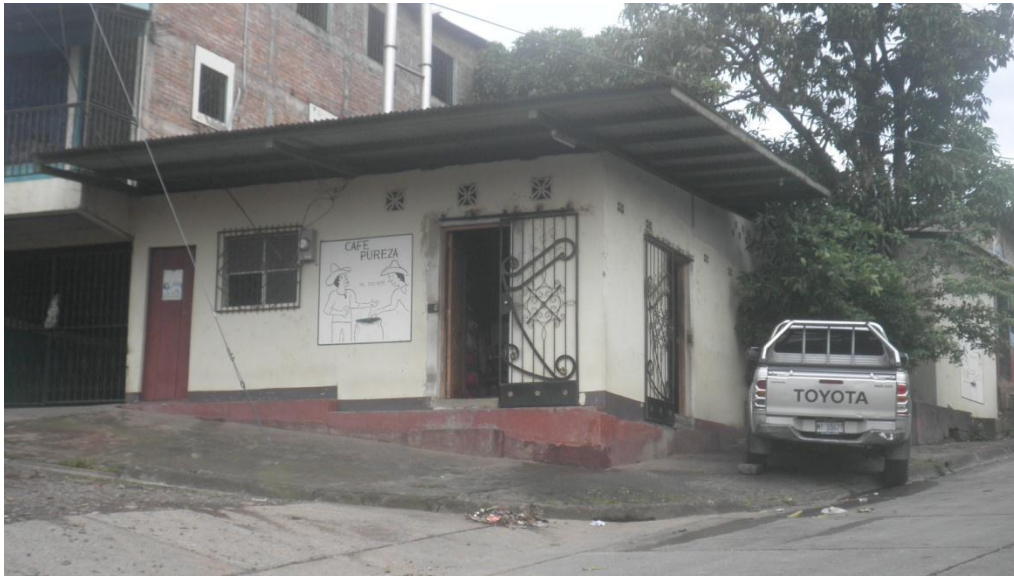
Logo de Café Pureza