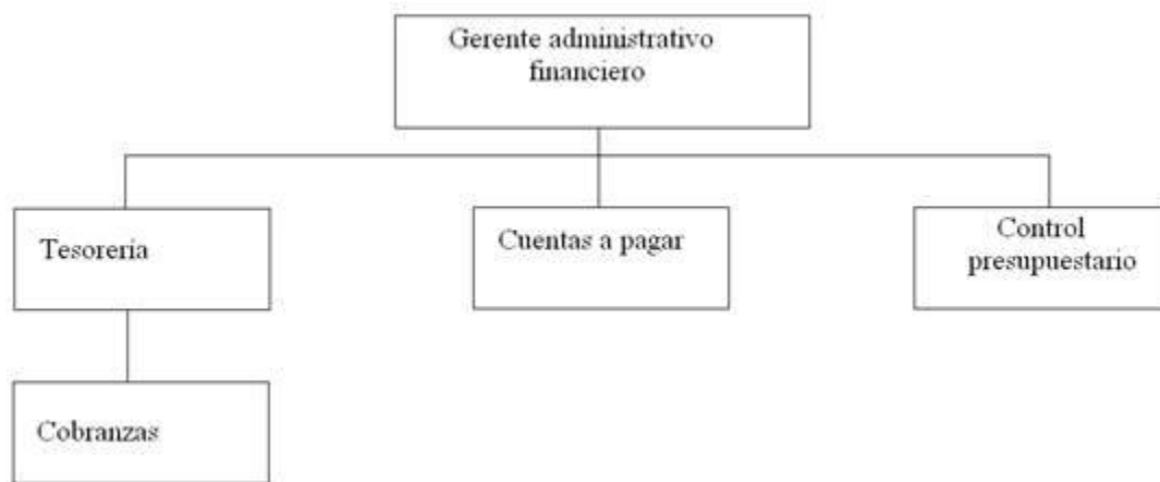
Cuadro N° 1.