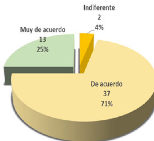
Figura 2. Actitud de los docentes hacia la integración de las TIC

En la figura 2 se puede observar que el 96% de los docentes manifiestan actitudes de acuerdo hasta muy de acuerdo hacia la integración de las TIC y solo el 4% se muestra indiferente. Sin embargo, en la entrevista al director del POLISAL y directores de departamento se evidencia que hay opiniones diferentes sobre la actitud de los docentes hacia la integración de las TIC. Entre las actitudes de los docentes hacia la integración de las TIC se mencionan positiva pero recesiva 1 . Orantes (2009) plantea, que las actitudes funcionan como modelos mentales, les dan a la persona una preferencia positiva o negativa sobre el objeto, una situación con la que se está en contacto, las actitudes de los docentes pueden variar desde los que están completamente de acuerdo con las bondades hasta los que las ven como una amenaza que atenta contra el proceso de enseñanza-aprendizaje.