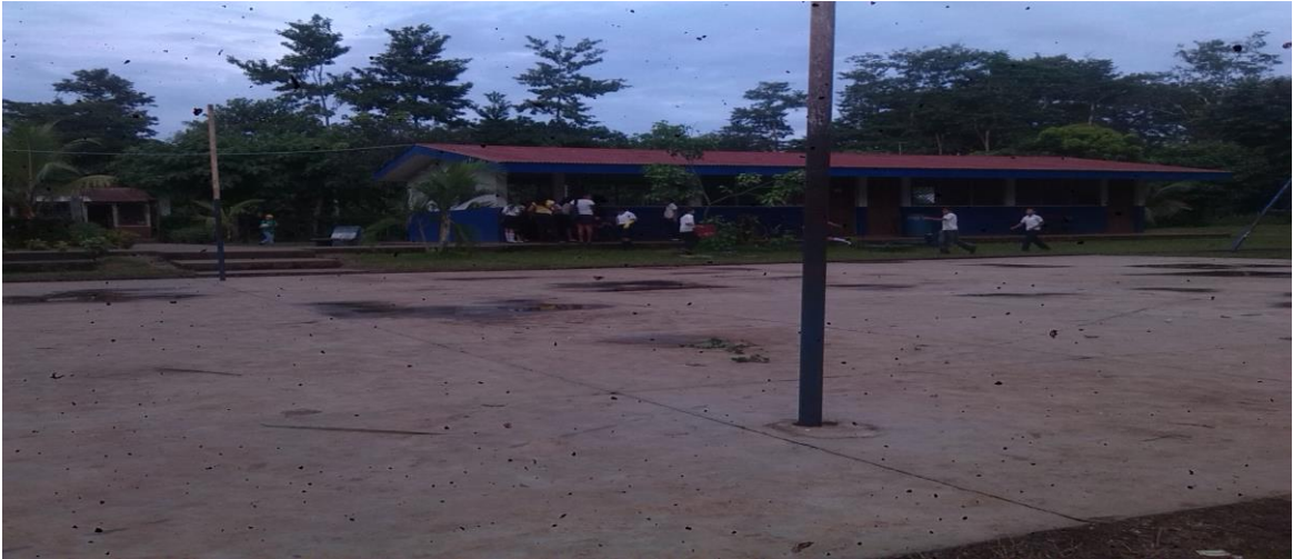
Escuela Miguel Larreynaga Las Azucenas