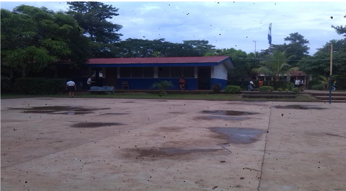
Dirección de la escuela Míguela Larreynaga