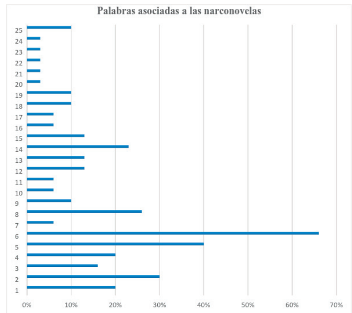
Gráfico 1. Palabras Asociadas a las Narconovelas

En el gráfico que se muestra a continuación, se muestran la opinión sobre las palabras asociadas a las narconovelas, por las y los adolescentes.