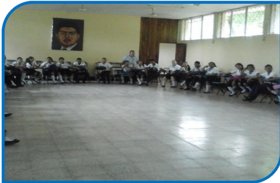
15.11.1. Estudiantes practicantes durante el desarrollo del plan de intervención pedagógica.