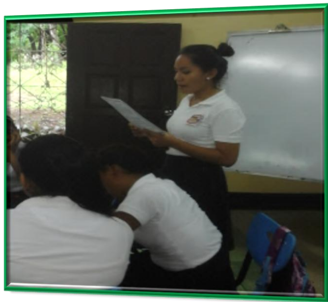
15.11.2. Estudiante practicante haciendo un análisis de la normativa de formación inicial docente.