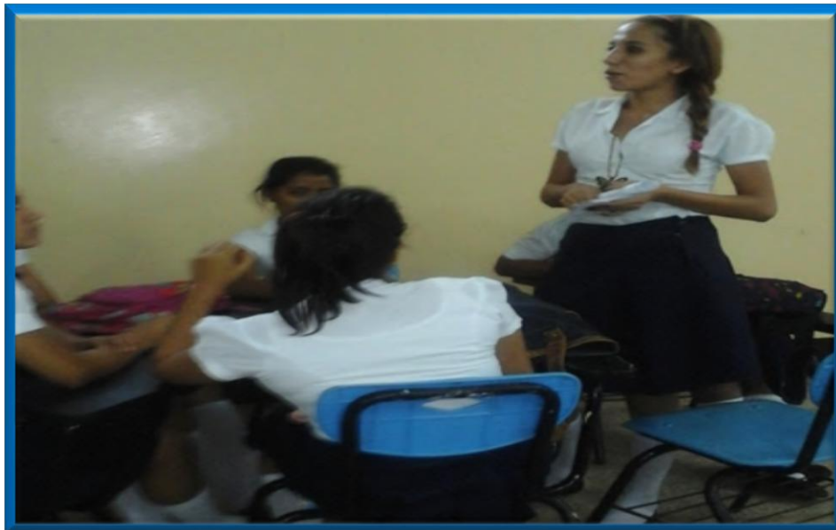
15.11.4. Estudiante practicante dando su opinión acerca de las estrategias metodológicas implementadas en la práctica docente.