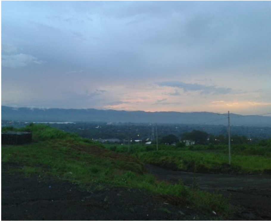
En la mina Sandino donde se observa deterioro del manto terrestre debido a las maquinas industriales