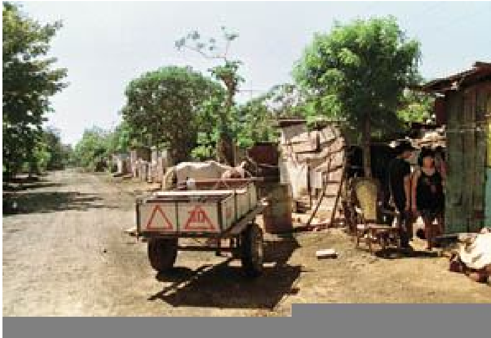
Foto tomada en unas de las calles de Nueva vida donde se observa la pobreza y el mal cuidado de los carretoneros