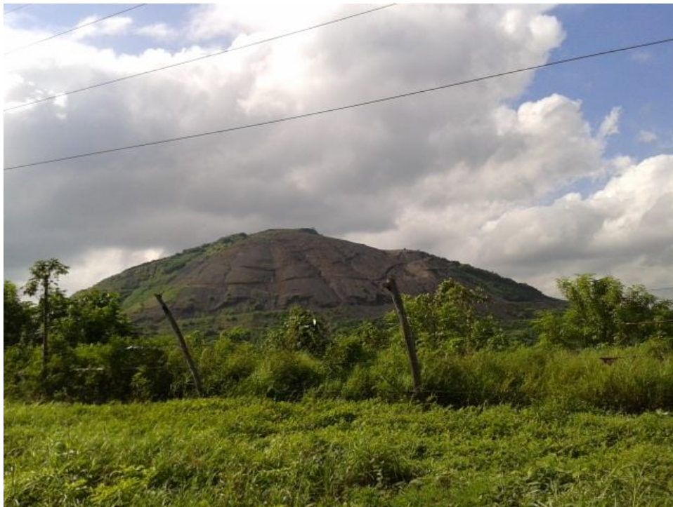
Cerro Mostatepe, se observa el desgaste y deterioro del cerro dentro de poco años va hacer un recurso extinto por la manos indiscriminada del hombre.