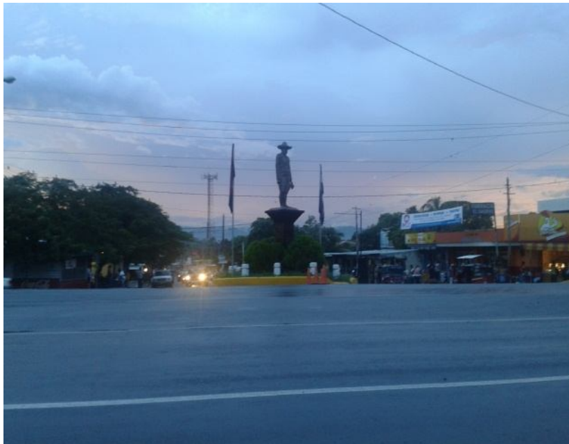
entrada de Ciudad Sandino, donde se observa la aglomeración de negocios de pequeños negocios sobre el bulevar de la paradas de los buses.